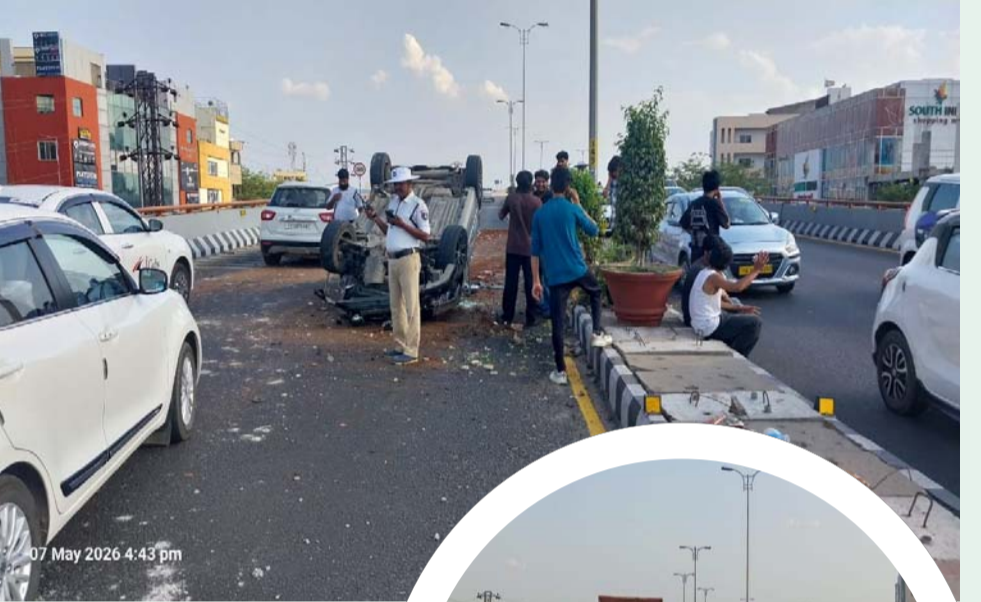
రాజేంద్రనగర్, మే 07 (ప్రజా జ్యోతి)

కారు అదుపుతప్పి డివైడర్ ను ఢీకొని, కారు పట్టి కారులో ఉన్న ముగ్గురు ఇంజనీరింగ్ విద్యార్థులకు గాయాలు