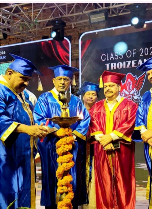
చేపల్లె, మే 4 (ప్రజా జ్యోతి):

రంగారెడ్డి మంగళవారం 5 మే 2026 సంపుటి: 16 సంఖిక: 281 పేజీలు: 8 వెల: 1/- విక్రం సంవత్సరం - పింగళి 2081, ఆషాఢము 3 ఇందియన్ సివిల్ క్యాలెండర్ - 1946, ఆషాఢము 17 పుర్ణిమంతా - 2081, ఆషాఢము 16 అమాంత - 2081, ఆషాఢము 3 తిథి శుక్రవారం తదియ నక్షత్రం పుష్యమి Published from RANGAREDDY, WARANGAL, KAMMAM, NALAGONDA http://www.prajajyothinews.com Mail: prajajyothidaily@gmail.com