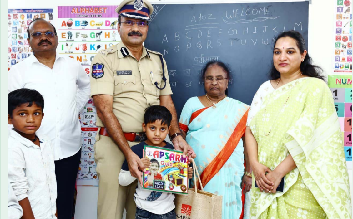
శేరిలింగంపల్లి, మే 04 (ప్రజాజ్యోతి):