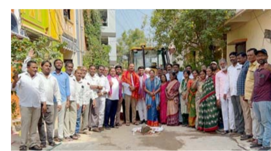
బిట్టెల్ పనులను కూడా వీలైనంత తొందరలో సాంకేతిక సేవలను పూర్తి చేస్తామని తెలిపారు. హైకోర్టు కాలనీ హెచ్ఎంటి చెరువుకి 30 కోట్ల రూపాయల నిధులు సాంకేతిక సేవలను అందించిన ఎమ్మెల్యే కు ప్రత్యేక ధన్యవాదాలు తెలుపుతూ డివిజన్లోని వైకుంఠాచల గురించి కొత్త ప్రతిపాదనలు పెట్టామని వాటిని ఎమ్మెల్యే ద్వారా సాంకేతిక సేవల విభాగంలో పనులు మొదలుపెడతామని తెలిపారు. కార్యక్రమంలో బిట్టెల్ పార్టీ సీనియర్ నాయకులు బస్సీ హనులు మహిళలు పెద్ద ఎత్తున పాల్గొన్నారు.