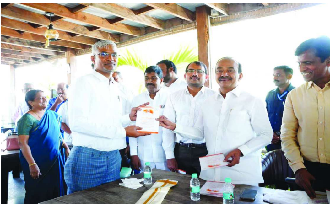
ప్రధాని నరేంద్ర మోడీ నేతృత్వంలోని కేంద్ర ప్రభుత్వం ఎంతో ప్రతిష్టాత్మకంగా ఆయుష్మాన్ భారత్ పథకాన్ని అమలు చేస్తే.. తెలంగాణలో సక్రమంగా అమలు కావడం లేదని తెలిపారు. విద్య, వైద్యం, ఉపాధి, విద్యుత్ వంటి వివిధ విభాగాలపై చర్చించి సమస్యల పరిష్కరించాలని దీక వేదికగా నిర్ణయం తీసుకున్నట్లు తెలిపారు.