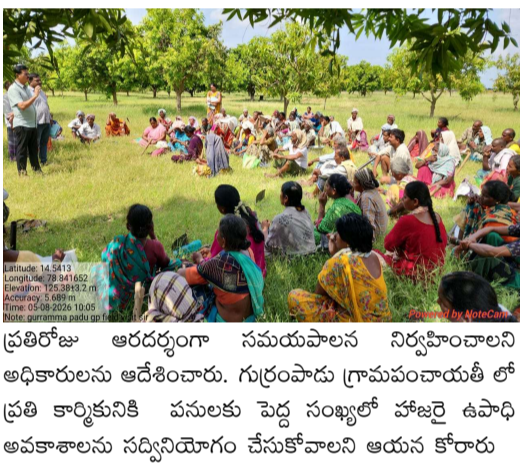
ప్రతిరోజు ఆరదర్భంగా సమయాలను నిర్వహించాలని అధికారులను అడేశారు. గుర్రంపాడు గ్రామపంచాయతీ లో ప్రతి కార్మికునికి పనులకు పెద్ద సంఖ్యలో హాజరై ఉపాధి అవకాశాలను సద్వినియోగం చేసుకోవాలని ఆయన కోరారు