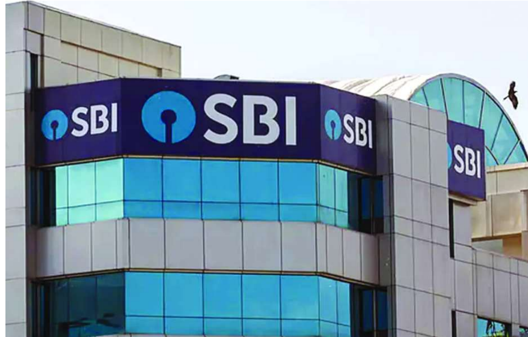
బ్యాంకింగ్ అంతటా మొత్తం మీద 1.1 కోట్ల మంది చెప్పారు. సాధారణంగా ఎంఎస్ ఎంఈలకు వర్తించే దానికంటే అధికారులు ఈ పథకం కింద ప్రయోజనం పొందుతారని తక్కువ వడ్డీ రేటు ఈ పథకం కింద ఉంటుందన్నారు.

ముంబై: కేంద్ర ప్రభుత్వం ప్రకటించిన 'అత్యవసర రుణ హామీ పథకం 5.0' కింద ఎన్ జీఐ కస్టమర్లకు పెద్ద మొత్తంలో రుణ సాయం లభించనుంది. ఈ పథకం కింద తమ కస్టమర్లకు రూ.70,000 నుంచి రూ.80,000 కోట్ల వరకు రుణాలు అందుబాటులో ఉంటాయని ఎన్ జీఐ చైర్మన్ సీఎస్ శెట్టి ప్రకటించారు. విడుదలైన మార్గదర్శకాలు ప్రకారం.. తమ కస్టమర్లలో ఎవరికి ఈ పథకం కింద రుణ అర్హత ఉందో తెలిసిందన్నారు. పశ్చిమాసియాలో యుద్ధ పరిస్థితులతో నౌకారవాణాకు అటంకాలు ఏర్పడి, సమస్యలను ఎదుర్కొంటున్న పరిశ్రమలకు మూలధన నిధుల మద్దతుకు గాను కేంద్ర ప్రభుత్వం రూ.2.55 లక్షల కోట్లతో ఈసీఎల్ జీఎస్ 5.0 పథకాన్ని మంగళవారం ప్రకటించడం తెలిసిందే. ఈ పథకం కింద ఎయిర్ లైన్స్ కు రూ.5,000 కోట్లను పక్కన పెట్టగా, మిగిలిన రూ.2.50 లక్షల కోట్లను ఎంఎస్ ఎంఈలతోపాటు, సమస్యలను ఎదుర్కొంటున్న ఇతర వ్యాపార సంస్థల రుణాల కోసం కేటాయించారు. పశ్చిమాసియా ఘర్షణల ప్రభావం చాలా రంగాలపై విస్తృతంగా ఉన్నట్లు శెట్టి చెప్పారు. ఈసీఎల్ జీఎస్ పథకాన్ని సకాలంలో తీసుకొచ్చిన చురుకైన చర్యగా పేర్కొన్నారు. అయితే, అర్హత ఉన్న ప్రతి ఒక్కరూ రుణం తీసుకుంటారని చెప్పలేమన్నారు. ఈ పథకానికి అమలుకు సంబంధించి నిర్వహణ అంశాలను బ్యాంకులు వచ్చే 8-10 రోజుల్లో పరిష్కరించుకుంటాయని తెలిపారు.