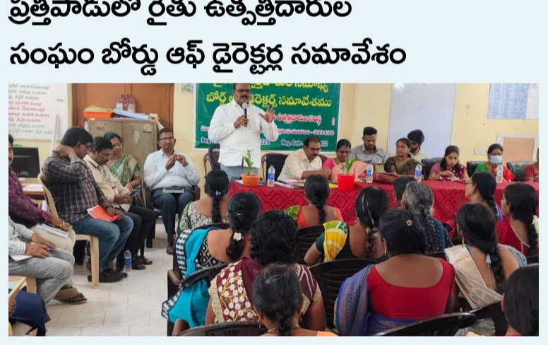
పత్తిపాడులో రైతు ఉత్పత్తిదారుల సంఘం బోర్డు ఆఫ్ డైరెక్టర్ల సమావేశం

పాలవరం నిర్వాసితులకు ఇండ్ల నిర్మాణ ఖర్చు రూ.2 లక్షలు పెంపు హర్షణీయం : బీజేపీ కూనవరం, మే 08 (ప్రజాజ్యోతి): పాలవరం జిల్లా కూనవరం మండలంలో పాలవరం ప్రాజెక్టు నిర్వాసితుల ఇండ్ల నిర్మాణ ఖర్చు పెంపుపై బీజేపీ నాయకులు హర్షం వ్యక్తం చేశారు. పాలవరం నిర్వాసితుల ఇంటి నిర్మాణానికి ఇప్పటివరకు రూ. 6,42,000గా ఉన్న మొత్తాన్ని రూ.6,85,000కు పెంచుతూ కేంద్ర-రాష్ట్ర ప్రభుత్వాలు తీసుకున్న నిర్ణయం శుభసూచకమని వారు పేర్కొన్నారు. అలాగే ఇంటి స్థలానికి రూ.1 లక్ష గృహ నిర్మాణానికి రూ.72 వేల అదనపు ప్రయోజనం కల్పించడం ముఖ్యంగా గిరిజనేతర కుటుంబాలకు వరప్రసాదంగా మారినదన్నారు. ప్రభుత్వం నిర్వాసితుల సమస్యలపై చిత్తశుద్ధితో పనిచేస్తూ ప్రజాభిప్రాయాన్ని దృష్టిలో పెట్టుకుని అధికారులు చర్యలు తీసుకోవడం అభినందనీయమని తెలిపారు. నీటిపారుదల శాఖ చీఫ్ సెక్రటరీ జి.వి. విడుదల చేయడం పట్ల సంతోషం వ్యక్తం చేశారు. ఈ సందర్భంగా బీజేపీ రాష్ట్ర నాయకుడు నోముల రామారావు, గిరిజన మోర్చా రాష్ట్ర ఉపాధ్యక్షుడు పాయం వెంకయ్య, జిల్లా కిసాన్ మోర్చా నాయకుడు నోముల సత్యనారాయణ, మండల అధ్యక్షుడు కరక పవన్ కుమార్, బీజేపీ మండల మహిళా అధ్యక్షురాలు సోయం సుధారాణి ప్రకటనలో తెలిపారు. నిర్వాసితుల తరఫున ప్రధాన మంత్రి సరేంద్ర మోదీ, ముఖ్యమంత్రి నారా చంద్రబాబు నాయుడు, ఉప ముఖ్యమంత్రి పవన్ కళ్యాణ్ కు ప్రత్యేక కృతజ్ఞతలు తెలిపారు. ఈ కార్యక్రమంలో సీనియర్ నాయకులు తుర్కపాటి కృష్ణ అర్జునరావు, గీడ శ్రీనివాసరావు, అంగర నలరాజు తదితరులు పాల్గొన్నారు.