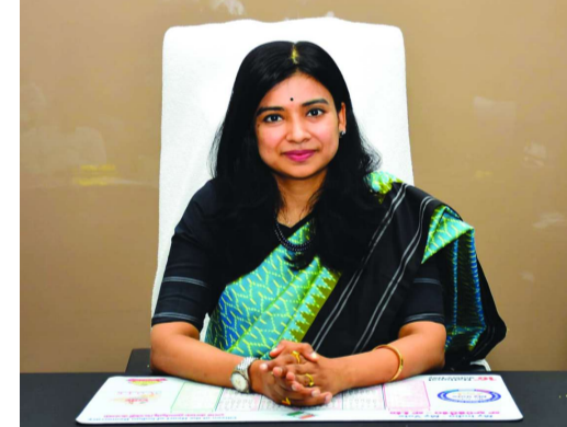
అగ్రవాలే కోరారు.జనగణనకు సంబంధించి ఏమైనా సందేహాలు ఉంటే హెల్ప్ లైన్ నెంబర్ 1855 కు సంప్రదించాలని, ఈ నంబర్ 24లి 7 అందుబాటులో ఉంటుందని పేర్కొన్నారు.

ఈ నెల 10 వ తేదీతో ముగియనున్న స్వీయ గణన గడువు జిల్లా కలెక్టర్, డ్రిన్సిపల్ సెన్సస్ ఆఫీసర్ గంప అగ్రవాలే రాజన్న సిరిసిల్ల : జన గణన 2027 లో భాగంగా స్వీయ గణన నమోదులో భాగస్వాములు కావాలని, ఈ నెల 10 వ తేదీతో స్వీయ గణన నమోదు గడువు ముగియనుందని జిల్లా కలెక్టర్, డ్రిన్సిపల్ సెన్సస్ ఆఫీసర్ గంప అగ్రవాలే కోరారు. ఈ మేరకు జిల్లా కలెక్టర్ గంప అగ్రవాలే శుభ్రాచారం ప్రకటన జారీ చేశారు. స్వీయ గణన కోసం వెబ్ సైట్ ద్వారా లాగిన్ కావాలని సూచించారు.ఈ మొత్తం ప్రక్రియకు కేవలం 5 నిమిషాల సమయం పడుతుందని, వెబ్ సైట్ పూర్తి స్థాయిలో సురక్షితమని స్పష్టం చేశారు. ప్రజల సమాచారం పూర్తిభద్రంగా గా ఉంటుందని వెల్లడించారు. 34 ప్రశ్నలకు సరైన సమాచారం నమోదు చేసి ప్రక్రియ పూర్తి చేయాలని తెలిపారు. అన్ని శాఖల అధికారులు, జిల్లాలోని ప్రజాప్రతినిధులు, ప్రభుత్వ- ప్రైవేట్ ఉద్యోగులు వారి మొబైల్ ఫోన్ల ద్వారా స్వీయ గణన చేసుకుని ప్రక్రియను విజయవంతం చేయాలని జిల్లా కలెక్టర్, డ్రిన్సిపల్ సెన్సస్ ఆఫీసర్ గంప