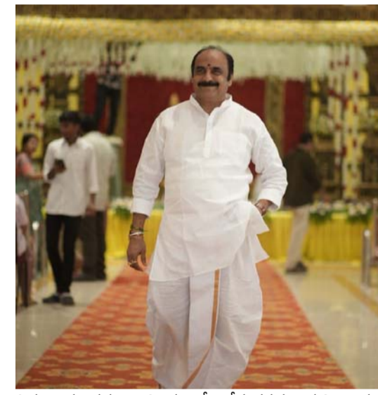
దిశగా ఈ పనులు ఎంతగానో దోహదపడతాయని ఆయన ఆశాభావం వ్యక్తం చేశారు.