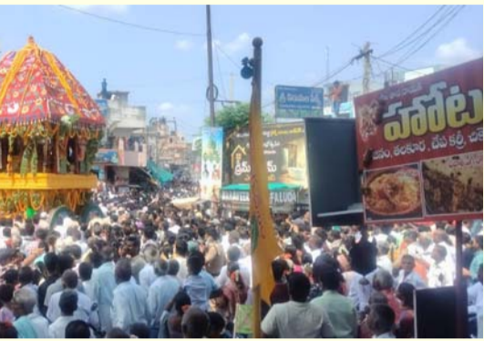
కార్యక్రమాలు ఏర్పాటు చేసి భక్తులకు సేవలు అందించారు. జమ్మలమడుగు బ్రహ్మోత్సవాల ప్రతి ఏడాది భక్తి వైభవానికి ప్రతీకగా నిలుస్తుండగా, ఈసారి జరిగిన రథోత్సవం మరింత ఘనంగా, చారిత్రాత్మకంగా నిలిచిందని భక్తులు ఆనందం వ్యక్తం చేశారు.

ప్రత్యేక ఆకర్షణగా నిలిచాయి. మహిళలు సంప్రదాయ దుస్తుల్లో కోలాటాలు ఆడుతూ భక్తి పరవశంలో మునిగిపోయారు. యువకులు భజన బృందాలతో పాల్గొని స్వామివారి మహిమను కీర్తించారు. పట్టణంలోని ప్రతి వీధి విద్యుత్ దీపాలతో అలంకరించడంగా, భక్తుల సందడి కారణంగా పండుగ వాతావరణం నెలకొంది. భక్తుల రద్దీని దృష్టిలో ఉంచుకుని పోలీసులు భారీ బందోబస్తు ఏర్పాటు చేశారు. ట్రాఫిక్ నియంత్రణతో పాటు భక్తులకు ఎలాంటి అసౌకర్యం కలగకుండా ప్రత్యేక చర్యలు చేపట్టారు. వైద్య శిబిరాలు, తాగునీటి సదుపాయాలు, అన్నదాన