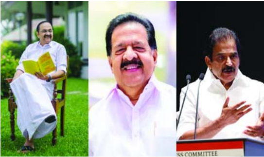
ఎన్నికల్లో కేరళలోని అలప్పుజ్ లోక్‌సభ స్థానం నుంచి గెలిచారు. లోక్‌సభకు ఎన్నికవడానికి ముందు ఆయన రాజస్థాన్ నుంచి రాజ్యసభ సభ్యునిగా ఉండేవారు.

కేసీ వేణుగోపాల్ కు ఛాన్స్ దక్కేనా? పదేళ్ల విరామం తర్వాత కాంగ్రెస్ సారథ్యంలోని యునైటెడ్ డెమోక్రటిక్ ఫ్రంట్ (యూడీఎఫ్) కూటమి కేరళలో గెలిచింది. 102 సీట్ల భారీ మెజారిటీని సాధించింది. ఇప్పటికే సీఎం సీటు కోసం జరుగుతున్న పోటీలో ప్రధానంగా ముగ్గురు అగ్రనేతల పేర్లు వినిపిస్తున్నాయి. వారే వి.డి.సతీశన్, కేసీ వేణుగోపాల్, రమేష్ చెన్నితాల. కేసీ వేణుగోపాల్ ప్రస్తుతం కాంగ్రెస్ జాతీయ ప్రధాన కార్యదర్శి(సంస్థాగత వ్యవహారాలు) హోదాలో ఉన్నారు. పార్టీ హైకమాండ్లోని ముఖ్య నేతలతో ఆయనకు మంచి పరిచయాలు ఉన్నాయి. ప్రత్యేకించి అగ్రనేత రాహుల్ గాంధీతో సాన్నిహిత్యం ఉంది. దీనికి తోడు మాజీ కేరళ షీసీసీ అధ్యక్షుడు కె.సుధాకర్ బహిరంగ మద్దతును ప్రకటించడంతో, రాష్ట్ర సీఎం రేసులో కేసీ వేణుగోపాల్ కూడా ఉన్నారనే టాక్ మొదలైంది. మాజీ సీఎంలు కే కరుణాకర్, ఓఎన్ చాంద్ బాటలోనే కాంగ్రెస్‌ను వ్యవస్థాగతంగా కేసీ వేణుగోపాల్ బలోపేతం చేస్తున్నారని ఇటీవలి కె.సుధాకర్ వ్యాఖ్యానించారు. కేసీ వేణుగోపాల్ 2024 సాధారణ