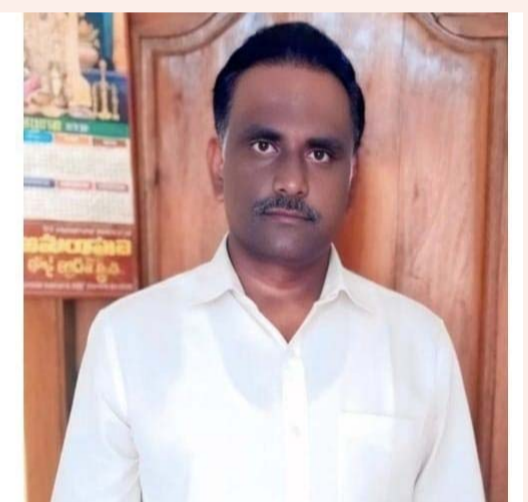
సీనియర్ నాయకులు, యువ కార్యకర్తలు, మాజీ ప్రతినిధులు పెద్ద ఎత్తున తరలివచ్చి ఈ సమావేశాన్ని జయప్రదం చేయాలని పిలుపునిచ్చారు. ఈ సమావేశానికి హాజరయ్యే కార్యకర్తలకు, నాయకులకు మధ్యాహ్నం భోజన సౌకర్యం కల్పించినట్లు పార్టీ మండల కమిటీ ప్రకటించింది.