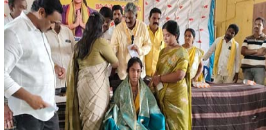
భవిష్యత్తులో ఉన్నత శిఖరాలు అధిరోహించాలని ఆకాంక్షించారు. ఈ సందర్భంగా టీడీపీ ప్రభుత్వం అమలు చేస్తున్న సంక్షేమ పథకాలు, ఎమ్మెల్యే నాయకత్వంపై విశ్వాసం వ్యక్తం చేస్తూ మండలంలోని పలు గ్రామాలకు చెందిన సుమారు 60 కుటుంబాలు ఇతర పార్టీలను వీడి తెలుగుదేశం పార్టీలో చేరడం సమావేశానికి మరంత ప్రాధాన్యతను తీసుకొచ్చింది. కొత్తగా చేరిన వారికి ఎమ్మెల్యే పార్టీ కండువాల కప్పి సాదరంగా అహ్వానించారు. కార్యక్రమం ఉద్దేశించి ఎమ్మెల్యే మాట్లాడుతూ పార్టీ కోసం కష్టపడే ప్రతి కార్యకర్తకు తాను ఎల్లప్పుడూ అందుబాటులో ఉంటానని, కార్యక్రమ సంక్షేమమే తన ప్రథమ కర్తవ్యమని స్పష్టం చేశారు. పార్టీ బలోపేతానికి గ్రామస్థాయిలో మరింత కృషి చేయాలని పిలుపునిచ్చారు. ఈ సందర్భంగా నాయకులు గత వైఎస్ఆర్ పాలనలో పోలవరం నిర్మాణం సమస్యలు