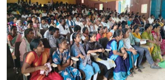
పరిష్కారం కాలేదని, ఆర్ అండ్ ఆర్ ప్యాకేజీ అమలులో విఫలమైందని తీవ్ర స్థాయిలో విమర్శించారు. చంద్రబాబు నాయుడు నాయకత్వంలో పోలవరం నిర్మాణం సమస్యలు న్యాయం జరుగుతుందని, ఈ ప్రాంత అభివృద్ధి కోసం ప్రత్యేక జిల్లాతో పాటు రూ.2000 కోట్ల నిధులు కేటాయించడం చారిత్రాత్మకమని పేర్కొన్నారు. మిగిలిన గ్రామాలకు 2029 నాటికి పూర్తి న్యాయం చేస్తామని ఎమ్మెల్యే భరోసా ఇచ్చారు. గండి కొత్తగూడెం, మెట్టరామవరం తదితర గ్రామాల్లో రహదారులు, స్టానిక సమస్యలను త్వరితగతిన పరిష్కరిస్తామని హామీ ఇచ్చారు. సమావేశంలో పార్టీ జిల్లా, మండల, అనుబంధ విభాగాల నాయకులు, గ్రామశాఖ అధ్యక్షులు, బూత్ ఇంచార్జులు, మహిళా నాయకులు, యువత ప్రతినిధులు మరియు కార్యకర్తలు భారీ సంఖ్యలో పాల్గొని కార్యక్రమాన్ని విజయవంతం చేశారు.