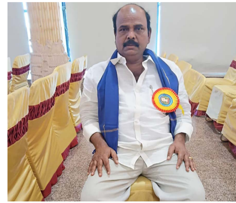
సాధించిన విజయం ఇప్పుడు - విజయ్ మాల సాధించారు తమిళనాడులో టీవీకే పార్టీ స్థాపించి ఏపార్టీతో కూడా పోత్తు పెట్టకోకుండా ఎవరికీ ఊడిగం చేయకుండా సింగల్ గా పోటీ చేసి ఇది నాసత్తాని సాధించిన విజయం ఉలగనాయకన్ కమల్ హాసన్