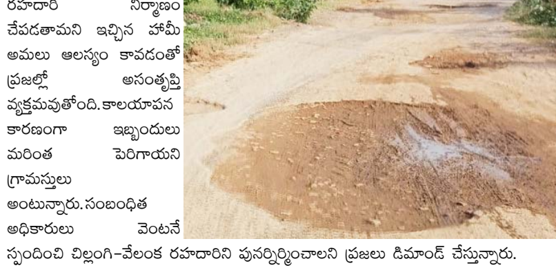
రహదారి నిర్మాణం చేపడతామని ఇచ్చిన హామీ అమలు అలస్యం కావడంతో ప్రజల్లో అసంతృప్తి వ్యక్తమవుతోంది. కాలయాపన కారణంగా ఇబ్బందులు మరింత పెరిగాయని గ్రామస్తులు అంటున్నారు. సంబంధిత అధికారులు వెంటనే స్పందించి చిల్లంగి-వేలంక రహదారిని పునర్నిర్మించాలని ప్రజలు డిమాండ్ చేస్తున్నారు.