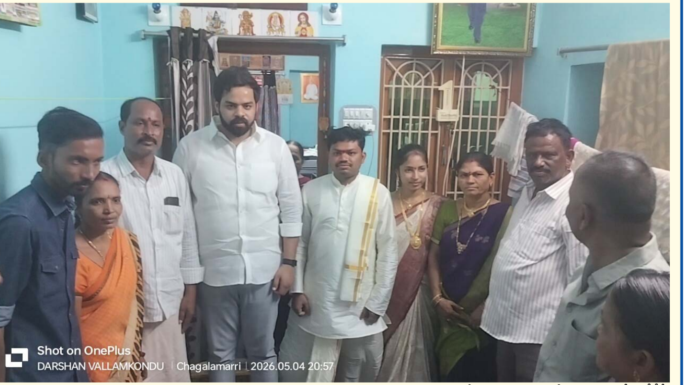
Chagalamarri | 2026.05.04 20:57