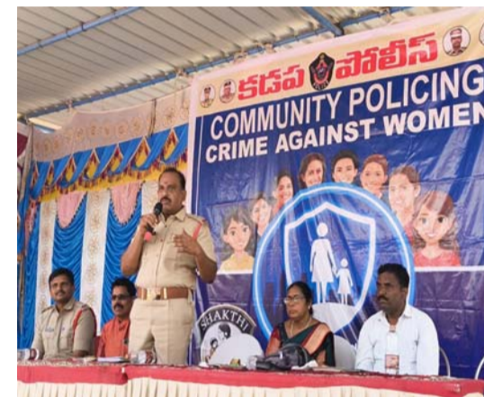
సంబంధిత డిఎంఎస్ కెలు కూడా హాజరయ్యారు. ఈ సందర్భంగా మహిళల సామాజిక, ఆర్థిక, రాజకీయ సాధికారతపై అవగాహన కల్పించారు. ప్రభుత్వ పథకాలు, మహిళల హక్కులు, సమస్యలు, సవాళ్లపై చర్చించారు. స్వయం ఉపాధి, నైపుణ్యాభివృద్ధి అవకాశాలపై వివరణ ఇచ్చారు. అలాగే మహిళల భాగస్వామ్యం, నాయకత్వ లక్షణాలను పెంపొందించే దిశగా సూచనలు చేశారు. ఈ కార్యక్రమం మహిళల్లో చైతన్యం పెంచి, వారి సాధికారతకు దోహదపడుతుందని అధికారులు పేర్కొన్నారు.