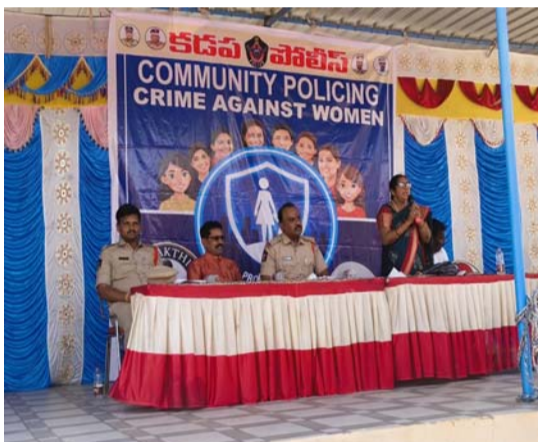
ఏపీఆర్ స్కూల్లో కమ్యూనిటీ పోలిసింగ్ కార్యక్రమం నిర్వహణ మహిళల భద్రత, హక్కులపై విస్తృత అవగాహన కార్యక్రమం మైలవరంలో 'క్రైమ్ అగెన్స్ట్ ఉమెన్'పై చైతన్య సదస్సు మే 3 ప్రజా జ్యోతి స్కూల్ మైలవరం మైలవరం, మే 3: ఈదినం (03.05.2026) ఉదయం 11.00 గంటల నుండి మైలవరం మండలంలోని ఏపీ రెసిడెన్షియల్ స్కూల్లో (మహిళా సాధికార సమావేశం) నిర్వహించారు. ఈ కార్యక్రమానికి వివిధ విభాగాలకు చెందిన అధికారులు, ప్రజాప్రతినిధులు, మహిళలు హాజరయ్యారు. ఈ