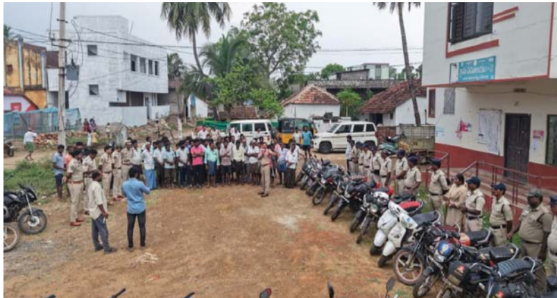
--కార్టెన్ సెర్టిలో 8 వాహనాలు స్వాధీనం --నేరాలపై ఉక్కుపాదం