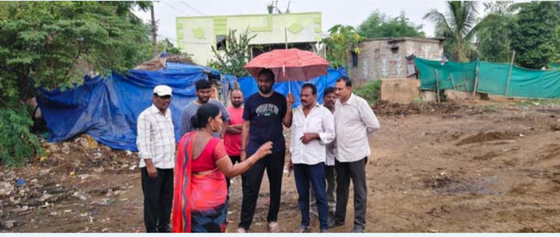
శరవేగంగా జలజీవన్ మిషన్ పనులు

కాకినాడ జిల్లా గొల్లప్రోలు (ప్రజా జ్యోతి) ప్రతినిధి. టోర నివారణకు పాటుపడే ప్రజలను తీసుకువచ్చి, విరాటపర్వం నియోజకవర్గ శాసనసభ్యులు, రాష్ట్ర ఉప ముఖ్యమంత్రి శ్రీ కొణిదెల పవన్ కళ్యాణ్ దూరదృష్టి ప్రజా సంక్షేమ సంకల్పం గొల్లప్రోలు పట్టణంలో సాకారమవుతోంది. నియోజకవర్గంలో దశాబ్దాలుగా పీడిస్తున్న తాగునీటి సమస్యకు శాశ్వత పరిష్కారం చూపాలనే పవన్ కళ్యాణ్ దృఢ సంకల్పంతో గొల్లప్రోలు టౌన్ పరిధిలో పనులు ముమ్మరంగా సాగుతున్నాయి. ప్రతి ఇంటికి స్వచ్ఛమైన తాగునీరు అందించడమే ధ్యేయంగా, కేంద్ర ప్రభుత్వ ప్రతిష్టాత్మక 'ప్రధానమంత్రి జల జీవన్ మిషన్' కింద పట్టణంలో నలుమూలలా నాలుగు కౌత్ నీటి ట్యాంకుల ఏర్పాటుకు ఆయన శ్రీకారం చుట్టడంపై స్థానిక ప్రజల నుండి బ్రహ్మాండం పడుతున్నాయి.