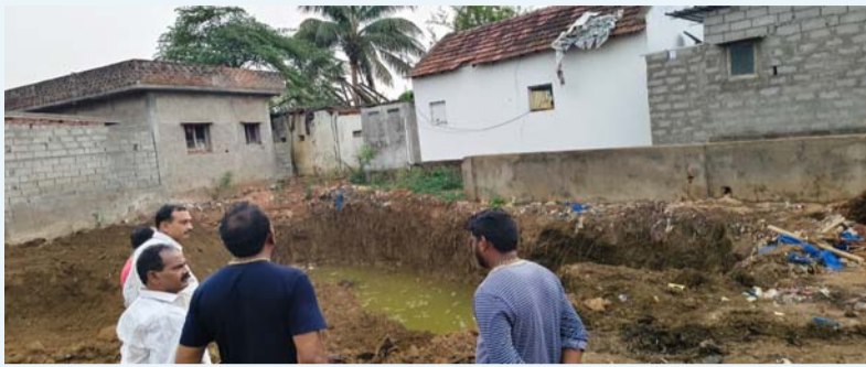
డిప్యూటీ సీఎం ఆదేశాలను

కాకినాడ జిల్లా గొల్లప్రోలు (ప్రజా జ్యోతి) ప్రతినిధి. టోర నివారణకు పాటుపడే ప్రజలను తీసుకువచ్చి, విరాటపర్వం నియోజకవర్గ శాసనసభ్యులు, రాష్ట్ర ఉప ముఖ్యమంత్రి శ్రీ కొణిదెల పవన్ కళ్యాణ్ దూరదృష్టి ప్రజా సంక్షేమ సంకల్పం గొల్లప్రోలు పట్టణంలో సాకారమవుతోంది. నియోజకవర్గంలో దశాబ్దాలుగా పీడిస్తున్న తాగునీటి సమస్యకు శాశ్వత పరిష్కారం చూపాలనే పవన్ కళ్యాణ్ దృఢ సంకల్పంతో గొల్లప్రోలు టౌన్ పరిధిలో పనులు ముమ్మరంగా సాగుతున్నాయి. ప్రతి ఇంటికి స్వచ్ఛమైన తాగునీరు అందించడమే ధ్యేయంగా, కేంద్ర ప్రభుత్వ ప్రతిష్టాత్మక 'ప్రధానమంత్రి జల జీవన్ మిషన్' కింద పట్టణంలో నలుమూలలా నాలుగు కౌత్ నీటి ట్యాంకుల ఏర్పాటుకు ఆయన శ్రీకారం చుట్టడంపై స్థానిక ప్రజల నుండి బ్రహ్మాండం పడుతున్నాయి.