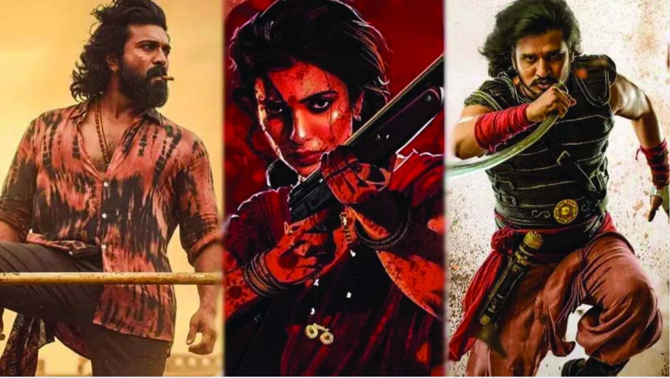
సిద్ధమవుతున్నాయి. ఇక వీటిలో ఏ సినిమా బాక్సాఫీస్ వద్ద సంచలనం సృష్టిస్తుందో చూడాలి.

ఒకేసారి నాలుగు సినిమాలు థియేటర్ లోకి రాబోతున్నాయి. 'బాలన్ ది బాయ్', 'ట్రాన్స్ ఫర్ త్రిమూర్తులు', హీరో కామెడీ మూవీ 'చెట్టు మీద దెయ్యం నాకేం భయం', అలాగే ఫ్యామిలీ ఎమోషన్స్ తో తెరకెక్కిన 'మా ఇంటి బంగారం' సినిమాలు ఒకేరోజు విడుదల కానున్నాయి. ఈ నాలుగు చిత్రాలు పూర్తిగా భిన్నమైన జోనర్ లో ఉండటంతో ప్రేక్షకులకు మంచి ఎంటర్ టైన్ మెంట్ ప్యాకేజీ లభించే అవకాశం ఉంది. ముఖ్యంగా హీరో కామెడీ సినిమాలకు ఇటీవల మంచి ఆదరణ లభిస్తున్న నేపథ్యంలో 'చెట్టు మీద దెయ్యం నాకేం భయం'పై ప్రత్యేక ఆసక్తి కనిపిస్తోంది. జూన్ చివరి వారం మాత్రం బాక్సాఫీస్ వద్ద భారీ హంగామా ఉండనుంది. జూన్ 26న పీరియాడిక్ యాక్షన్ డ్రామా 'స్వయంభూ' విడుదల కానుంది. ఈ సినిమాపై ఇప్పటికే సినీ వర్గాల్లో మంచి బజ్ నెలకొంది. అదే రోజున సాస్ థ్రిల్లర్ డ్రామా 'సూపర్ గోల్' కూడా ప్రేక్షకుల ముందుకు రానుంది. ఇక రాజకీయ నేపథ్యంతో తెరకెక్కిన అంటిన్స్ డ్రామా 'లెనిన్' కూడా జూన్ 26నే విడుదల కానుండటం విశేషం. దీంతో నెలాఖరులో మూడు ప్రధాన చిత్రాలు ఒకేసారి బాక్సాఫీస్ బరిలోకి దిగనున్నాయి. మొత్తం మీద చూస్తే 2026 జూన్ నెల టాలీవుడ్ ప్రేక్షకులకు పుల్ ఎంటర్ టైన్ మెంట్ ఇవ్వబోతోందనే చెప్పాలి. భారీ పాన్ ఇండియా సినిమాలనుంచి చిన్న కాస్ట్ మూవీస్ వరకు అన్ని రకాల చిత్రాలు ప్రేక్షకులను అలరించేందుకు