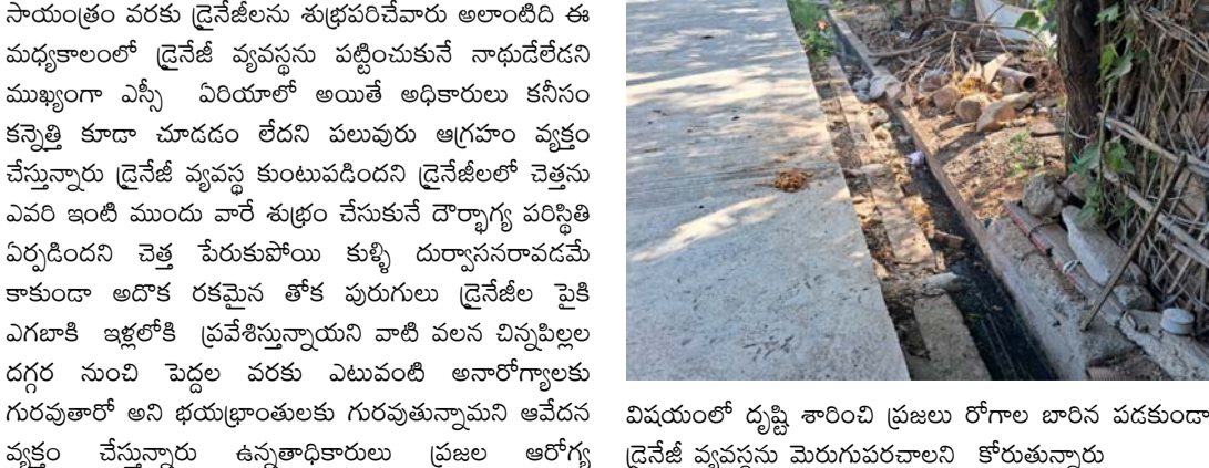
విషయంలో దృష్టి శాించి ప్రజలు రోగాల బారిన పడకుండా డ్రైనేజీ వ్యవస్థను మెరుగుపరచాలని కోరుతున్నారు

తాళ్లపూడి, మే 22, ప్రజాజ్యోతి న్యూస్ మండల కేంద్రమైన తాళ్లపూడి గ్రామ పంచాయతీ పరిధిలో పలు డ్రైనేజీలు శుభ్రం లేక పరిసర ప్రాంతం అంతా దుర్గంధం వెదజల్లడంతో దుర్వాసన భరించలేకపోతున్నామని స్థానికులు వాపోతున్నారని గతంలో ఉదయం నుండి మధ్యాహ్నం వరకు గ్రామంలోని వీధులను శుభ్రం చేసి మధ్యాహ్నం నుండి