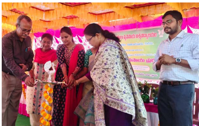
-- వ్యవసాయ ప్రదర్శన ఘనంగా