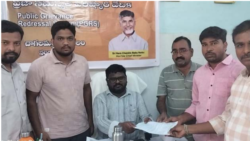
యం ఆర్ ఓ కు వినతి పత్రం అందజేసిన చాగలమర్రి మెడికల్ షాపుల యజమాన్లులు.....

చాగలమర్రి, మే 18 (ప్రజాజ్యోతి స్పాన్సర్); సంద్యాల జిల్లా మండల కేంద్రమైన చాగలమర్రి పట్టణంలో మే 20వ తేదీ అఖిల భారత కెమిస్ట్రల సమాఖ్య ఆల్ ఇండియా సమ్మే సందర్భంగా చాగలమర్రి తాశీల్దారుకు వినతి పత్రం అందజేశారు. చాగలమర్రిలోని పలు మెడికల్ షాపుల బండ్ కు