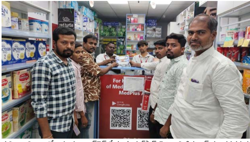
పిలుపునివ్వాలని కోరారు. ఈ

చాగలమర్రి, మే 18 (ప్రజాజ్యోతి స్పాన్సర్); సంద్యాల జిల్లా మండల కేంద్రమైన చాగలమర్రి పట్టణంలో మే 20వ తేదీ అఖిల భారత కెమిస్ట్రల సమాఖ్య ఆల్ ఇండియా సమ్మే సందర్భంగా చాగలమర్రి తాశీల్దారుకు వినతి పత్రం అందజేశారు. చాగలమర్రిలోని పలు మెడికల్ షాపుల బండ్ కు