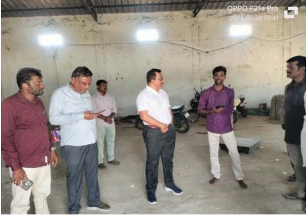
- ఆర్డీఓ సృష్టమైన ఆదేశాలు