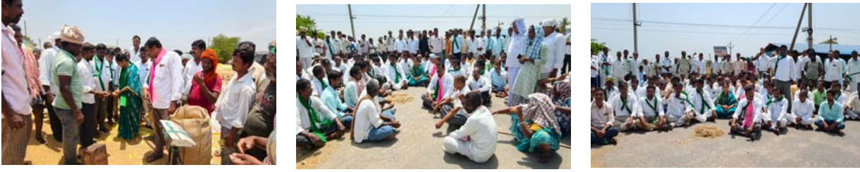
ధాన్యం కొనక రైతును రోడ్డెక్కించిన కాంగ్రెస్ ప్రభుత్వం