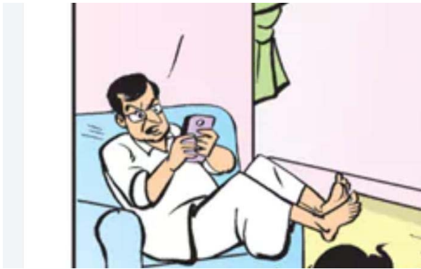
అవినీతిపై పంచాయతీ అధికారుల చర్యలు శూన్యం. విచారణకే పరిమితమైన పంచాయతీ అధికారులు.

జిల్లా కలెక్టర్ పంచాయతీ అధికారులపై చర్యలు తీసుకోవాలి. కొండాపూర్ ప్రజా జ్యోతి మండల పరిధిలోని మునిదేవునిపల్లి గ్రామంలో 15వ ఆర్థిక పంచాయతీ నిధులు 7లక్షలు గ్రామపంచాయతీ ఖాతాలో నుండి పంచాయతీ కార్యదర్శి, సర్పంచ్, ఉప సర్పంచ్, పనిచేయకుండానే పంచాయతీ డబ్బులు విత్ డ్రా అనే కథనం ప్రజా జ్యోతి దినపత్రికలో ఏప్రిల్ 22న ప్రచురించడంతో స్పందించిన పంచాయతీ అధికారి డిఎల్విడీ ఏప్రిల్ 22న విచారణ చేసి నివేదిక పై అధికారులకు అందిస్తామని తెలిపి నెల రోజులు కావస్తున్న అవినీతిపై అధికారుల చర్యలు శూన్యమయ్యాయి. ఆధారాలతో అవినీతి జరిగిన జిల్లా పంచాయతీ అధికారుల నిర్లక్ష్యం. విచారణ చేసి నేలలు గడుస్తున్న అవినీతిపై ఎలాంటి చర్యలు లేవు.