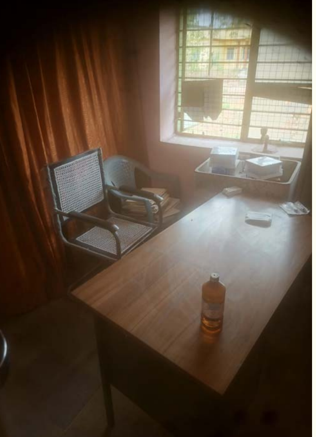
సిబ్బందిని నియమించి, రోగులకు ఎలాంటి ఇబ్బందులు లేకుండా సేవలు అందించాలని కోరుతున్నారు.

జిన్నారం/ప్రజాజ్యోతి ప్రజలకు నాణ్యమైన వైద్య సేవలు అందించాల్సిన ప్రభుత్వ ఆసుపత్రిలో నిర్లక్ష్యం కొట్టాల్సినట్లు కనిపిస్తుంది. జిన్నారం ప్రభుత్వ ఆసుపత్రిలో రక్త పరీక్షలు నిర్వహించే సిబ్బంది నెల రోజులుగా విధులకు హాజరుకాకపోవడంతో, రోగులు తీవ్ర ఇబ్బందులు ఎదుర్కొంటున్నారు. ప్రతిరోజూ వందల సంఖ్యలో వచ్చే పేషెంట్లకు వైద్యులు రక్త పరీక్షలు రాస్తున్నప్పటికీ, పరీక్షలు చేసే సిబ్బంది లేకపోవడంతో ల్యాబ్ సేవలు పూర్తిగా నిలిచిపోయాయి. ఆసుపత్రిలో రక్త సమూహాలు సేకరించే గది ఎప్పుడూ ఖాళీ కుర్చీలతోనే కనిపిస్తోందని రోగులు వాపోతున్నారు. “సిబ్బంది నెలవులో ఉన్నారు”, “ఆసుపత్రి పనిమీద వెళ్లారు” అంటూ అధికారులు సమాధానాలు చెబుతున్నారని, కానీ సమస్య మాత్రం పరిష్కారం కావడం లేదని ప్రజలు ఆగ్రహం వ్యక్తం చేస్తున్నారు. జ్వరం, షుగర్, వైరల్ ఇన్ఫెక్షన్ , రక్తహీనత వంటి అనారోగ్యాలతో వచ్చే రోగులకు పరీక్షలు అత్యవసరం అయినప్పటికీ, ప్రభుత్వ ఆసుపత్రిలో సేవలు అందకపోవడంతో ప్రైవేట్ ల్యాబ్లను ఆశ్రయించాల్సి వస్తున్నదని బాధితులు చెబుతున్నారు. దీంతో పేద కుటుంబాలపై అదనపు ఆర్థిక భారం పడుతోంది. “ప్రభుత్వ ఆసుపత్రికి వస్తే ఉచిత వైద్యం అందుతుందని భావిస్తున్నాం. కానీ పరీక్షలు లేక బయటకు పంపించడం దారుణం. ప్రైవేట్ కేంద్రాల్లో పరీక్షలకు వందల రూపాయలు ఖర్చు చేయాల్సి వస్తోంది” అంటూ పలువురు రోగులు ఆవేదన వ్యక్తం చేశారు. ఇలాంటి పరిస్థితులపై ఉన్నతాధికారులు వెంటనే స్పందించి, విధులకు నిర్లక్ష్యంగా దూరంగా ఉంటున్న సిబ్బందిపై చర్యలు తీసుకోవాలని ప్రజలు డిమాండ్ చేస్తున్నారు. అలాగే ఆసుపత్రిలో నిరంతరం అందుబాటులో ఉండే ల్యాబ్