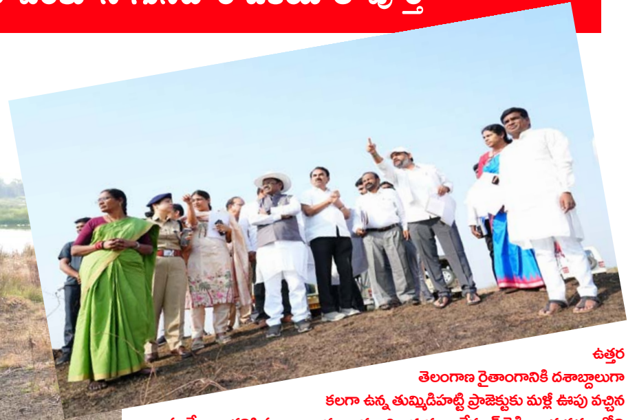
ఉత్తర తెలంగాణ రైతాంగానికి దశాబ్దాలుగా కలగా ఉన్న తుమ్మిడిహట్టి ప్రాజెక్టుకు మళ్లీ ఊపు వచ్చిన సంతోషాలు కనిపిస్తున్నాయి. ముఖ్యమంత్రి ఎనుముల రేవంత్ రెడ్డి నాయకత్వంలోని కాంగ్రెస్ ప్రభుత్వం తుమ్మిడిహట్టి ప్రాజెక్టును తిరిగి ప్రాధాన్యంగా తీసుకుని ముందుకు వెళ్లాలనే దృఢ సంకల్పంతో ఉన్న నేపథ్యంలో