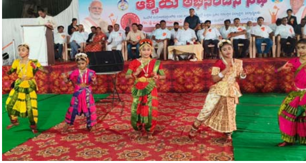
లక్ష్మీ సాధన తో అనుకున్న గమ్యానికి చేరాలి