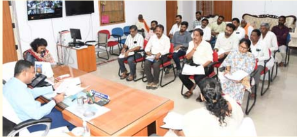
ఉచితంగా మట్టి సేకరణకు పూర్తి అనుమతి అటవీ వ్యర్థాల రవాణాకు సహకారం

ఆదిలాబాద్ బ్యూరో, మే 21 (ప్రజా జ్యోతి) ఆదిలాబాద్ కుమ్మరుల జీవనో పాధి అభివృద్ధికి జిల్లా యం త్రాంగం అండగా నిలుస్తుందని జిల్లా కలెక్టర్ రాజర్షి షా హామీ ఇచ్చారు. గురువారం కలెక్టర్ టోలో కుమ్మర సంఘం ప్రతినిధులతో నిర్వహించిన సమావేశంలో వారి సమస్యలను ఓపికగా విన్న ఆయన, పరిష్కారానికి తక్షణ చర్యలు తీసుకుంటామని తెలిపారు. ప్రభుత్వ జీవో ప్రకారం జిల్లాలోని కుమ్మరులు చెరువులు, కుంటల నుంచి ఉచితంగా మట్టిని సేకరించుకునే హక్కు ఉందని కలెక్టర్ స్పష్టం చేశారు. మట్టి సేకరణలో ఎలాంటి అటంకాలు లేకుండా సంబంధిత అధికారులకు ఆదేశాలు జారీ చేస్తామని పేర్కొన్నారు. మట్టి పాత్రలు కాల్చేందుకు అవసరమైన అటవీ వ్యర్థాల రవాణా పై కూడా ఫార్వర్డ్ అధికారులతో సమన్వయం చేసి అనుమతులు కల్పిస్తామని