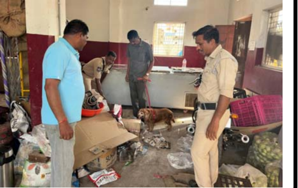
పడకుండా తల్లిదండ్రులు అప్రమత్తంగా ఉండాలని తెలిపారు.

ఆదిలాబాద్ బ్యూరో, మే 19, (ప్రజా జ్యోతి) ఆదిలాబాద్ పట్టణంలోని బస్టాండ్, రైల్వే స్టేషన్, మార్కెట్ పరిసర ప్రాంతాలలో డ్రగ్స్, గంజాయి అక్రమ రవాణా, విక్రయాలను అరికట్టేందుకు పోలీసు అధికారులు నార్కోటిక్ జాగిలం “రోమా” సహాయంతో ప్రత్యేక తనిఖీలు నిర్వహించారు. అనుమానాస్పద వ్యక్తులు, వస్తువులు, బ్యాగులను క్షుణ్ణంగా తనిఖీ చేసి ప్రజలకు అవగాహన కల్పించారు. జిల్లాలో మత్తు పదార్థాల నిర్మూలనకు పోలీసులు నిరంతరం ప్రత్యేక చర్యలు చేపడుతున్నారని, గంజాయి లేదా ఇతర మత్తు పదార్థాల విక్రయాలు, వినియోగంపై సమాచారం తెలిసిన వెంటనే పోలీసులకు తెలియజేయాలని సూచించారు. యువత డ్రగ్స్ బారిన