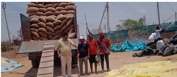
వెల్దుర్తి (ప్రజాజ్యోతి) మే 06: