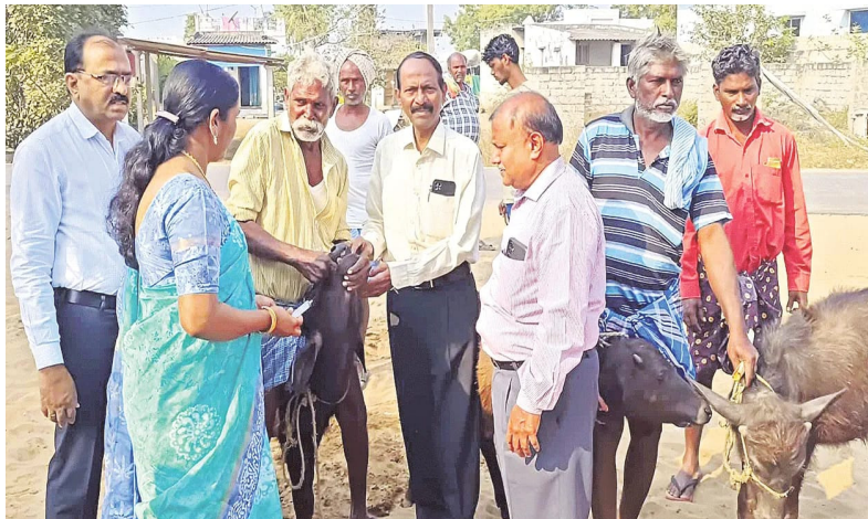
కర్నూల్ 2.మే.ప్రజా జ్యోతి:

- ఇది రైతులకు ఆదాయం పెరగడానికి దోహదపడు పడుతుంది