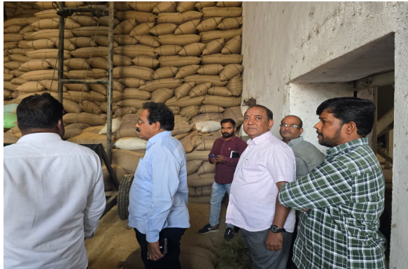
పేర్కొన్నారు. ఈ కార్యక్రమంలో సిబ్బందితో తదితరులు పాల్గొన్నారు.