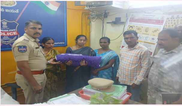
మెడక్ మే 13

శిశు విక్రయాలు జరిగితే కఠిన చర్యలు తీసుకుంటాము