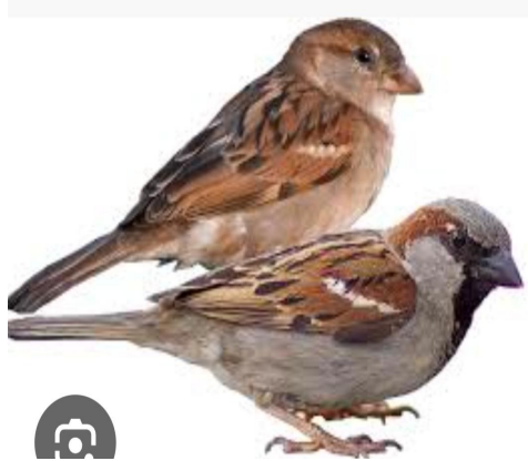
కల్లో 5. 13.మే. ప్రజా జ్యోతి :

జీవితచరిత్ర - ముఖ్యమైన బిందువులుపిచ్చుకలు చిన్న శరీరపు పక్షులు; పలుసార్లు ఏడాదికి గుడ్లు వేసి మరో కీలకమైన సంతానం ఉత్పత్తి చేస్తాయి అని వ్రాసారు సూచిస్తాయి. ఇవి పట్టణాలు, గ్రామాల ఆవాసాల్లో వాతావరణానికి దగ్గరగా జీవించేవి; ఇంటి చూరు, గోడల నెర్రలు, నిల్వ ధాన్యాల్లో గుడేసి పెరుగుతాయి. పిచ్చుకల ఆశ్రయకాలం సాధారణంగా చిన్నదే--బహుశా కొన్ని సంవత్సరాలు నుంచి వ్యత్యాసం ఉంటుంది; పర్యావరణం బదులైతే వాటి జనాభా త్వరగా మారిపోయే అవకాశం ఉంది. ఎటువంటి పరిస్థితుల్లో పిచ్చుకల్ని పెంచాలి (పర్యావరణం, ఆహారం, గూడు)ఆహారం: చిన్నదూ తినదగ్గ ధాన్యాలు, కీటకాలు (ఇన్సెక్ట్) మరియు పిచ్చుకలకు సరిపోయే గింజలు అందించాలి; పంటల ముంగిటల దగ్గర సహజ ఆహార వనరులు పెరగేలా జాగ్రత్త చేయాలి. గూడు: ఇంటి చూరులు, గోడల నెర్రలు లేదా నష్టాలు తక్కువగా ఉండే తాపర ప్రాంతాల్లో చిన్న గూడు పెట్టెలను అమర్చవచ్చు; మాతృశ్రామం కోసం సురక్షిత ప్రదేశాలు అవసరం. నీరు మరియు కప్పులు: తరచుగా తిండ నీరు, స్నానం చేయడానికి చిన్న పక్క బావులు/పాత్రలు ఉంచటం ద్వారా అవి ఆకర్షించబడతాయి. సెల్ టవర్లు --- సమస్యలు, గణనీయ సాక్ష్య పరిస్థితి