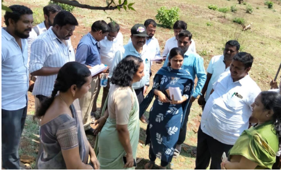
కొండాపూర్ ప్రజా జ్యోతి: