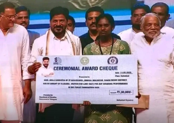
గ్రామస్థులు, ఉపాధ్యాయులు హర్షం వ్యక్తం చేస్తున్నారు.