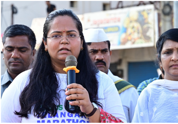
మెడక్ (ప్రజాజ్యోతి) 11 మే, 2026 :