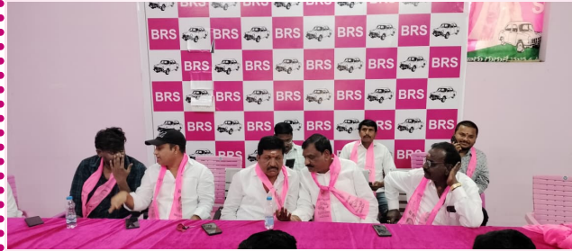
రామాయంపేట ప్రజా జ్యోతి 11: