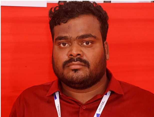
అందోలు, మే11, (ప్రజాజ్యోతి):

-రాష్ట్ర ప్రభుత్వం ఫీజుల నియంత్ర చట్టం తీసుకురావాలి-ఎర్రోళ్ల మహేష్ ఎస్ఎఫ్ఐ రాష్ట్ర కమిటీ సభ్యులు