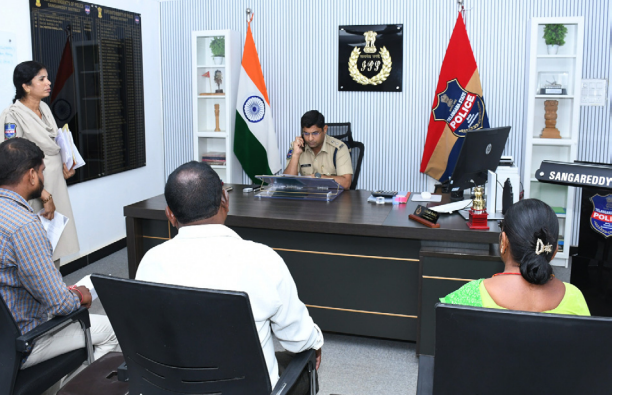
కార్యాలయంలో నిర్వహించే ప్రజావాణి కార్యక్రమాన్ని వినియోగించుకోవాలని సూచించారు. ప్రజల సమస్యల పరిష్కారానికి పోలీస్ శాఖ ఎల్లప్పుడూ అందుబాటులో ఉంటుందని తెలిపారు.

జరిపి, బాధితులకు త్వరితగతిన న్యాయం జరిగేలా చర్యలు తీసుకోవాలని సంబంధిత పోలీసు అధికారులకు సూచనలు చేశారు. ప్రజా సమస్యల పరిష్కారంలో ఎలాంటి నిర్లక్ష్యం సహించబోమని స్పష్టం చేశారు. ఈ సందర్భంగా జిల్లా ప్రజలను ఉద్దేశించి ఎస్సీ మాట్లాడుతూ, స్థానిక పోలీస్ స్టేషన్లలో సమస్యలు పరిష్కారం కాకపోతే ఎలాంటి భయాందోళనలకు గురికాకుండా, మధ్యవర్తుల అవసరం లేకుండా నేరుగా జిల్లా పోలీస్