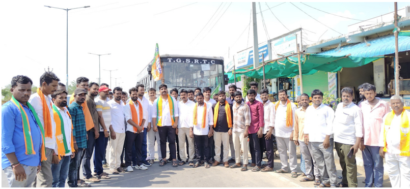
కొల్వారం (ప్రజాజ్యోతి) మే 10 :