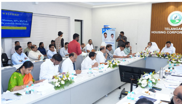
నారాయణఖేడ్, ప్రజాజ్యోతి ఏప్రిల్ 30:

తెలంగాణ రాష్ట్ర సచివాలయంలో గురువారం ఉదయం ఉమ్మడి మెడక్ జిల్లాకు సంబంధించిన ఇందిరమ్మ ఇండ్ల నిర్మాణ పనులపై ఉన్నత స్థాయి సమీక్షా సమావేశం రాష్ట్ర రెవెన్యూ, గృహ నిర్మాణ శాఖ మంత్రి పొంగులేటి శ్రీనివాస్ రెడ్డి, వైద్యారోగ్య శాఖ మంత్రి దామోదర రాజనర్సింహ అధ్యక్షతన జరిగింది. ఈ