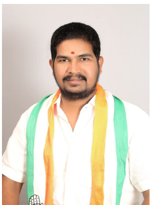
ప్రజా జ్యోతి సంగారెడ్డి స్టాఫ్ రిపోర్టర్ :

పార్టీ బలోపేతమే నా లక్ష్యం - పట్నాల నాగరాజు గౌడ్