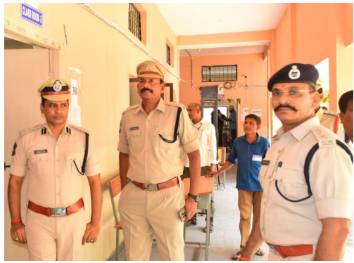
గద్వాలలో ఎస్పీ టి.