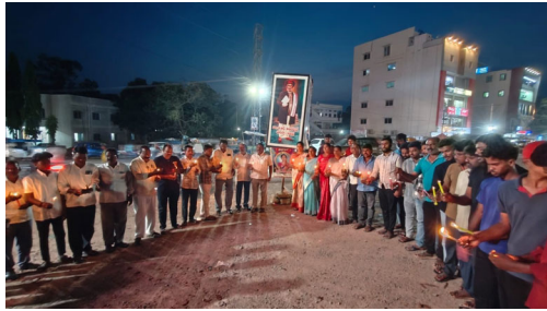
ప్రభుత్వాన్ని విజ్ఞప్తి చేశారు. యువతలో సామాజిక బాధ్యత పెంపొందించేలా అవగాహన కార్యక్రమాలు నిర్వహించాలని నాయకులు సూచించారు. కార్యక్రమంలో బీఆర్ఎస్ పార్టీ నాయకులు, మహిళా విభాగ ప్రతినిధులు, ప్రజా సంఘాల నాయకులు, విద్యార్థులు, పట్టణ ప్రజలు పాల్గొన్నారు.