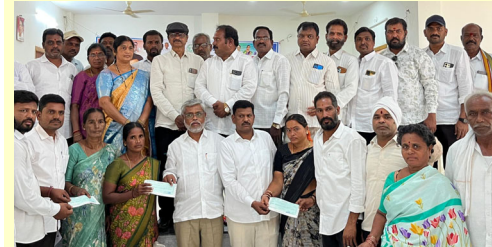
జడ్చర్ల, మే 1 ( ప్రజా జ్యోతి )

-- జడ్చర్లలో కల్యాణ లక్ష్మి, షాదీ ముబారక్ చెక్కుల పంపిణీ