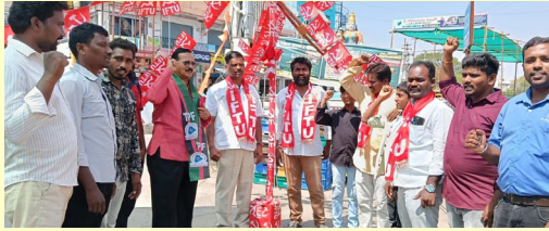
గద్వాల ప్రజా జ్యోతి మే 01:

మేడే స్మార్ట్ తో కార్మిక కోడ్లకు వ్యతిరేకంగా ఉద్యమించాలి