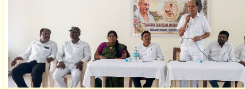
నాగర్ కర్నూల్ : మే 18 (ప్రజా జ్యోతి)