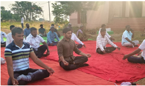
చిన్నబావి మే 18 (ప్రజా జ్యోతి)

-యోగ, వాకింగ్ తో ఆరోగ్యాన్ని కాపాడుకోవాలి : ఎంపీడీవో సర్జ ఆదర్శ గౌడ్