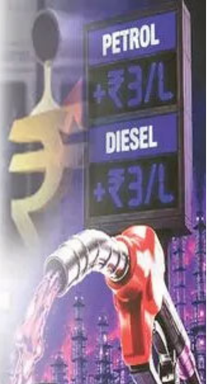
పశ్చిమాసియా దేశాల మధ్య యుద్ధం ప్రభావం పేద,

మధ్యతరగతి కుటుంబాలను వెంటాడుతూనే ఉన్నాయి. నిత్యావసర సరుకుల ధరలు పెరిగి సతమతమవుతున్న కుటుంబాలకు పెట్రోల్, డీజిల్ మంట అంటుకుంది. యుద్ధ ప్రభావంతో గ్యాస్ భారం మోస్తున్న సామాన్యుల బతుకు బండిపై కేంద్ర ప్రభుత్వం పెంచిన పెట్రోల్, డీజిల్ ధరలు మరింత భారాన్ని పెంచింది. కేంద్ర ప్రభుత్వం ముందస్తుగానే పెట్రోల్, డీజిల్ ధరలు పెరుగుతాయని సంకేతాలు ఇస్తున్నట్లుగానే పెట్రోల్ లీటరుకు రూ 3.39, డీజిల్ పై రూ 3.27 పెంచింది. ఐదు రాష్ట్రాల ఎన్నికల మూగినే వరకు ఆగిన పెట్రోల్ ధరలు ఒక్కసారిగా పెరగడంతో రాజన్న సిరిసిల్ల జిల్లాలో నిరసనలు వ్యక్తమవుతున్నాయి. జిల్లాలో 78 వరకు వివిధ చమురు కంపెనీలకు సంబంధించిన పెట్రోల్ బంకులు ఉన్నాయి. వీటి ద్వారా జరిగే పెట్రోల్ డీజిల్ విక్రయాలపై తాజాగా పెరిగిన చమురు వారం ప్రతినెల దాదాపు రూ 5 కోట్ల వరకు వాహనదారులు భరించాల్సి ఉంటుంది.