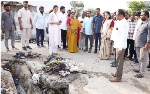
జిల్లా కలెక్టర్ సీ హెచ్ ప్రియాంక