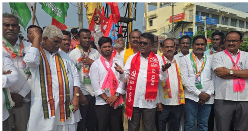
నారాయణపేట ప్రతినిధి మే 13 ప్రజా జ్యోతి