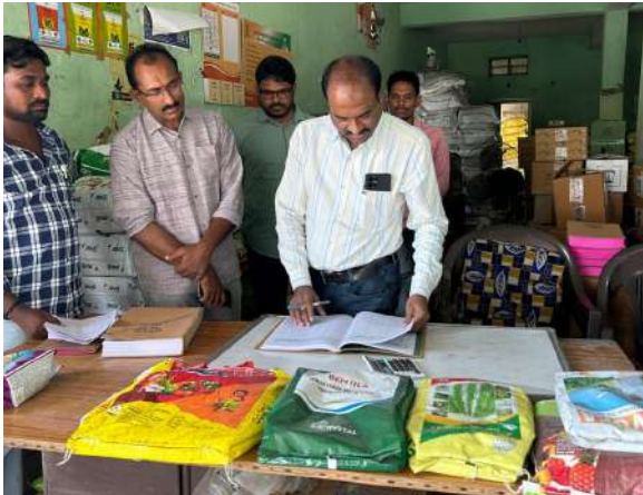
హెచ్చరించారు, రైతులు విత్తనాలు లేదా ఎరువులు కొనుగోలు చేసే సమయంలో తప్పనిసరిగా బిల్లు తీసుకోవాలని నకిలీ విత్తనాలు అధిక ధరలకు అక్రమ నిల్వలకు సంబంధించి సమాచారాన్ని తెలిసిన వెంటనే సంబంధిత వ్యవసాయ శాఖ అధికారులకు తెలియజేయాలని జిల్లా వ్యవసాయ అధికారి, రైతులను కోరారు