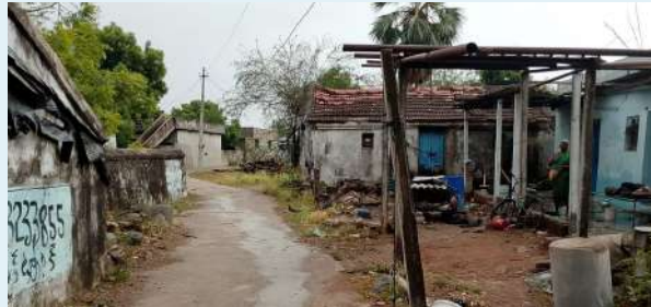
కాల్వ శ్రీరాంపూర్ మే 25 (ప్రజాజ్యోతి)

కాల్వ శ్రీరాంపూర్ మండలంలో పొద్దంతా భానుడి ప్రతాపం తో భగభగ ఎండలకు మనుషులు అతులంతులం కాగా. వడదెబ్బకు పట్టల రాలిపోతున్నారు. సాయంత్రం వేళ తీవ్రగాలి వాన మంగళవారం రోజున తీవ్ర బీభత్సం సృష్టించింది. కిష్టంపేట్. మోట్లపల్లి. మీర్లంపేట్. తారుపల్లి. చిన్నరా తుపల్లి. తదితర గ్రామాల్లో రేకుల ఇండ్లు పైకప్పులు లేచిపోయాయి. దినితో తీవ్ర నష్టం వాటిల్లగా. రోడ్డుకు ఇరువైపులా చెట్ల కొమ్మలు విరిగి రోడ్డుపై పడడంతో. వాహనాల రాకపోకలకు తీవ్ర అంతరాయం కలిగింది. కొనుగోలు కేంద్రాల్లో వరి ధాన్యం తడిసి ముద్దయ్యాయి. ప్రభుత్వం స్పందించి వెంటనే కొనుగోలు చేపట్టి రైతులను ఆదుకోవాలని. కూలిపోయిన రేకుల షెడ్ల బాధితులకు నష్టపరిహారం అందించి ఆదుకోవాలని. బాధితులు కోరుతున్నారు