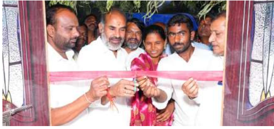
వేములవాడ,మే,18:ప్రజాజ్యోతి. పేదల సొంతింటి కలను నిజం చే

యడమే ప్రజా ప్రభుత్వ లక్ష్యం అని రాష్ట్ర ప్రభుత్వ విప్ ఆది శ్రీనివాస్ అన్నారుచందుర్తి మండలం సనుగుల గ్రామంలో ఇందిరమ్మ ఇల్లు గృహప్రవేశ కార్యక్రమంనుంగా నిర్వహించారు. ఈ కార్యక్రమానికి రాష్ట్ర ప్రభుత్వ విప్ ఆది శ్రీనివాస్ ముఖ్యఅతిథిగా హాజరై లబ్ధిదారులకు శుభాకాంక్షలు తెలిపారు. అనంతరం లబ్ధిదారులకు నూతన వస్త్రాలను అందజేశారు ఈ సందర్భంగా మాట్లాడుతూ, పేదల సొంతింటి కలను నిజం చేయడమే ప్రభుత్వ లక్ష్యమని పేర్కొన్నారు. ఇందిరమ్మ ఇళ్ల పథకం ద్వారా అర్హులైన ప్రతి కుటుంబానికి గౌరవ ప్రద మైన నివాసం కల్పించే దుకు ప్రభుత్వం కట్టుబడ ఉండన్నారు ప్రభుత్వం అందిస్తున్న సంక్షేమ పథకాలను ప్రజలు సద్వినియోగం చేసుకోవాలని సూచించారు