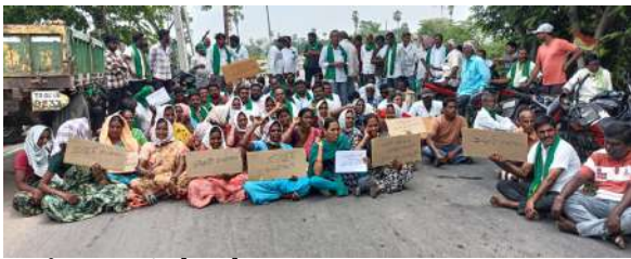
మార్కెట్ డిఎం హామీతో ఆందోళన విరమణ

ఇల్లంతకుంట మే14(ప్రజాజ్యోతి)రాజన్నసిరిసిల్ల జిల్లా ఇల్లంతకుంట మండలంలోని పలు గ్రామాల రైతులు ఆరుకాలం శ్రమించి కష్టపడి పండించిన పంటలను కొనుగోలు చేయాలని రోడ్దెక్కారు. తాము పండించిన పొద్దుతిరుగుడు విత్తనాలను కొనుగోలు చేయాలని వంతడుపుల-కరీంనగర్ ప్రధాన రహదారిపై రోడ్డుపై బయ్యాయిని రాస్తారోకో చేపట్టారు. గంటల తరబడి రాస్తారోకో చేపట్టిన కూడా ప్రభుత్వం నుంచి గాని, అధికారుల నుంచి గాని ఏ లాంటి హామీ రాకపోవడంతో, ఇల్లంతకుంట మండల కేంద్రం వద్దకు పాదయాత్రగా రైతులు పెద్ద ఎత్తున ర్యాలీ నిర్వహించారు. మండల కేంద్రంలో ని వివేకానంద విగ్రహం వద్దకు రైతులు ర్యాలీగా చేరుకొని రోడ్డుపై బయ్యాయిని. ఈ సందర్భంగా రైతులు వినూత్న రీతిలో వంటకార్యు రోడ్డుపైనే చేసి నిరసన తెలిపారు. తీవ్రమైన ఎండలో సైతం రైతులు.. మహిళా రైతులు పెద్ద ఎత్తున ఆందోళన చేపట్టారు. గంటల తరబడి ఇల్లంతకుంట మండల కేంద్రంలోని వివేకానంద విగ్రహం వద్ద ఆందోళన చేపట్టారు. చివరకు ఆందోళన మూసిన పలు గ్రామాల రైతులు తాత్కాలికంగా గ్రీన్ కార్పెట్ ను ఏర్పాటు చేశారు.