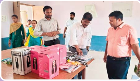
ఐటీడీపి ప్రాంగణంలోని వైటీసీలో నిరుద్యోగ గిరిజన యువతి యువకులతో, యువతీ యువకులతో సంబంధించిన అంశాలను శిక్షకులతో, యువతీ యువకులతో లకు సర సెంటర్ కార్యకలాపాలకు మిగతా 2 లో... ▶

భద్రాచలం టౌన్, మే 6 ప్రజాజ్యోతి నిరుద్యోగులైన గిరిజన యువతి యువకులు జీవితంలో స్థిరపడటానికి వైద్య సిద్ధాంతం అందించే శిక్షణలు సద్వినియోగం చేసుకునేలా సంబంధిత శిక్షకులు యువతీ యువకులకు అవగాహన కల్పించాలని ఐటీడీపి సహాయ ప్రాజెక్టు అధికారి జనరల్ డేవిడ్ రాజ్ అన్నారు. బుధవారం