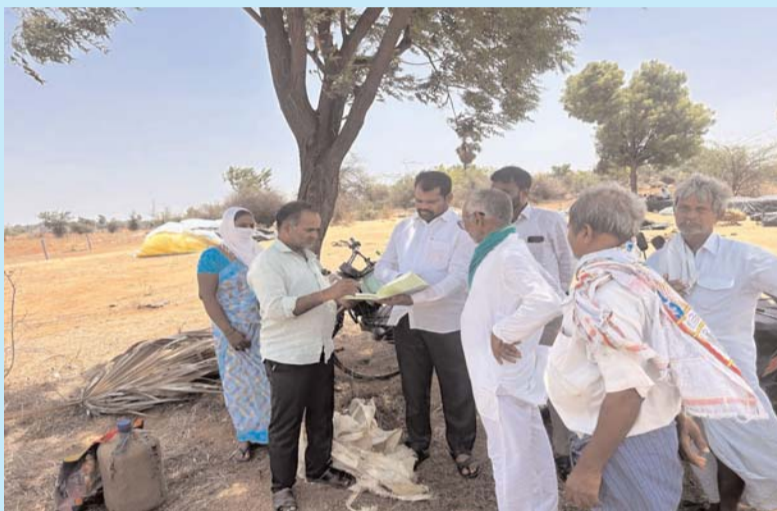
ధాన్యాన్ని వెనువెంటనే మిల్లలకు తరలించేలా అధికారులను సమన్వయం చేస్తున్నట్లు పేర్కొన్నారు. ఈ కార్యక్రమంలో స్థానిక నాయకులు, పెద్ద సంఖ్యలో రైతులు పాల్గొన్నారు.