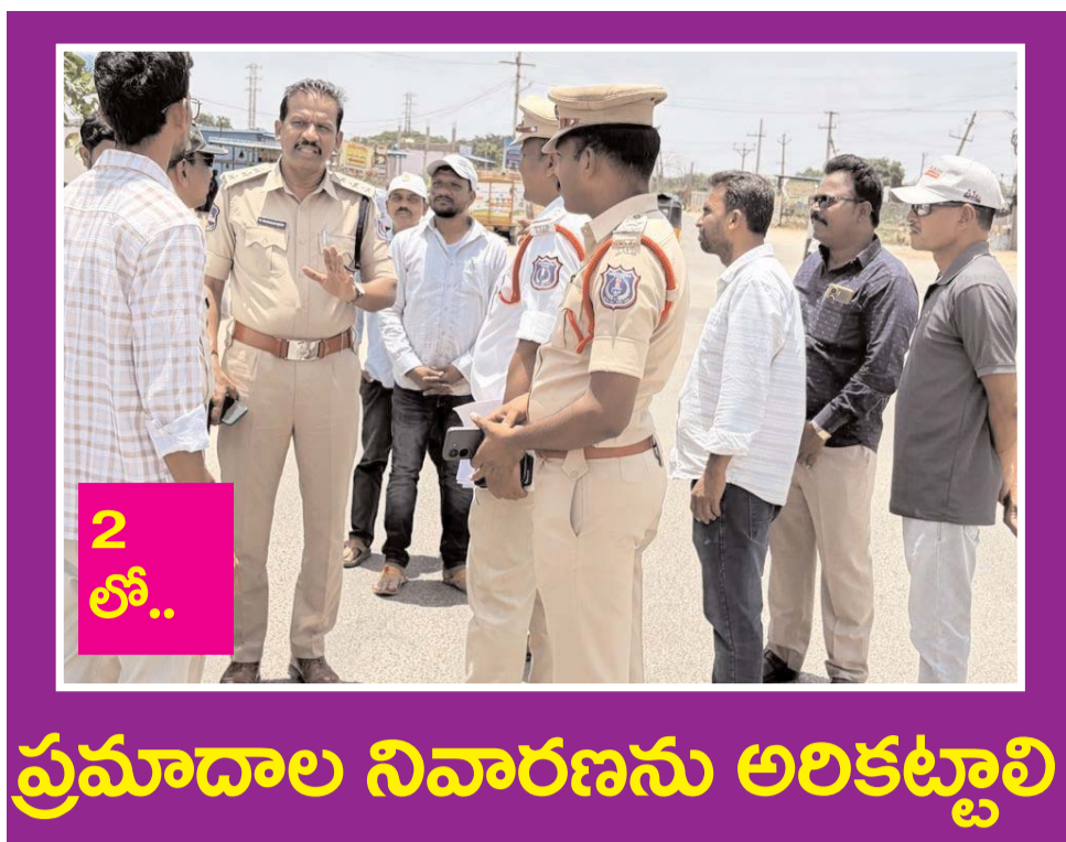
ప్రమాదాల నివారణను అరికట్టాలి