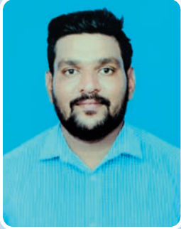
అల్లూరి సాంబశివ రావు

యానాంబైలు గ్రామపంచాయతీ పరిధిలో దళితులకు ప్రభుత్వం కేటాయించిన ఇనాం భూములపై వస్తున్న అక్రమణలు, అక్రమ లీజుల ఆరోపణలపై మాదిగ రిజర్వేషన్ పోరాట సమితి (ఎమ్మార్సీపీఎస్) తీవ్రంగా ఖండిస్తుంది. వెట్టిచాకిరి నుంచి విముక్తి పొందిన దళిత కుటుంబాలకు జీవనాధారం కోసం ప్రభుత్వం కేటాయించిన భూములు కేవలం ఆస్తి మాత్రమే కాదు, వారి ఆత్మగౌరవానికి ప్రతీక అలాంటి భూములను "100 ఏళ్ల లీజు" పేరుతో తప్పుడు పత్రాలు సృష్టించి అక్రమించడం అత్యంత దుర్మార్గం. యానాంబైలు ప్రాంతంలో దళితుల అమాాయకత్వాన్ని అసరాగా చేసుకుని భూములను కాజేయాలని చూస్తున్న వారిపై ప్రభుత్వం వెంటనే కఠిన చర్యలు తీసుకోవాలి. దళిత కుటుంబాలకు న్యాయం చేయాల్సిన అధికారులు నిర్లక్ష్యం వహిస్తే ఎమ్మార్సీఎస్ ఆధ్వర్యంలో పెద్ద ఎత్తున ఉద్యమం చేపడతాం. దళితులకు చెందిన ఒక్క సెంటు భూమిని కూడా అక్రమంగా అక్రమించేందుకు ప్రయత్నించినా సహించేది లేదు. జిల్లా కలెక్టర్ వెంటనే ప్రత్యేక విచారణకు ఆదేశించి భూముల అసలు యజమానులకు న్యాయం చేయాలి. అసైన్డ్ భూములపై జరుగుతున్న అక్రమాలను అరికట్టడంలో ప్రభుత్వం విఫలమైతే గ్రామస్థులతో కలిసి కలెక్టరేట్ ముట్టడి, నిరసన కార్యక్రమాలు చేపడతాం. దళితుడి భూమి అంటే దళితుడి బతుకు... దాని జోలికొస్తే ఎమ్మార్సీఎస్ ఊరుకోదు.