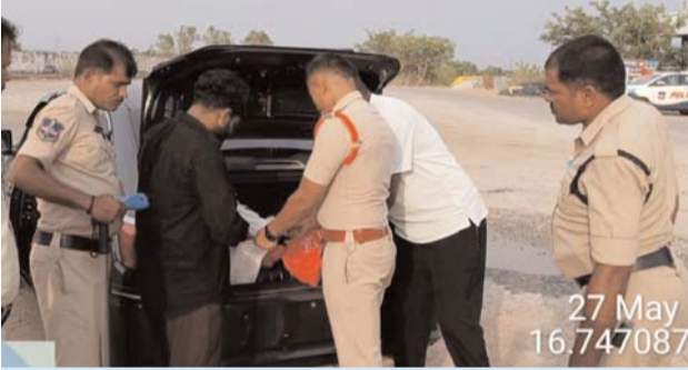
27 May 16,747087