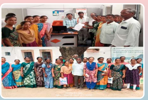
తగిన పరిహారం కల్పించాలని ప్రభుత్వాన్ని కోరారు. వారి వినతి పత్రం ని స్వీకరించిన అధికారులు సమస్యను పరిశీలించి ఉన్నతాధికారుల దృష్టికి తీసుకెళ్లమని హామీ ఇచ్చినట్లు సమాచారం.

మినరల్ వాటర్ ఫ్లాంట్లలో నీటిని క్రమ పద్ధతిలో శుద్ధి చేయడం లేదనే విమర్శలు ఉన్నాయి. బోరు నుండి వచ్చే నీటిలో మోతాదుకు మించి మినరల్స్ ఉంటాయి. మెగ్నీషియం, సల్ఫేట్, బోరాన్, మాంగనీస్ తదితర మినరల్