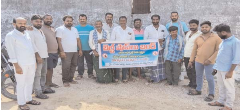
నాంపల్లి, మే 22 (ప్రజా జ్యోతి):