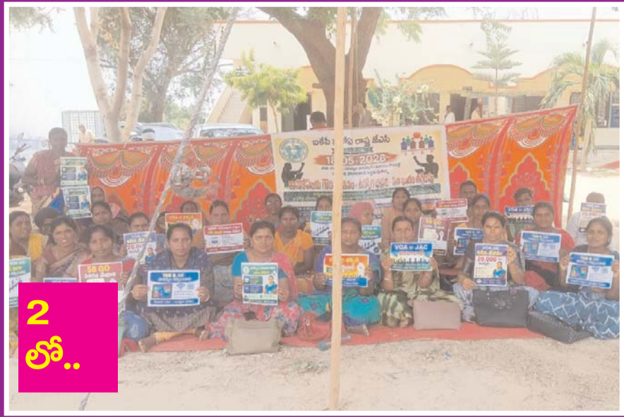
వీవోపలకు ఉద్యోగ భద్రత కల్పించాలి