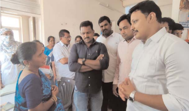
ఆసుపత్రిని బీఆర్ఎస్ నాయకులతో కలిసి పరిశీలించారు. అనంతరం

హాలియాలో 30 పడకల ఆసుపత్రిని వెంటనే ప్రారంభించాలని నాగార్జునసాగర్ మాజీ ఎమ్మెల్యే నోముల భగత్ డిమాండ్ చేశారు. శుక్రవారం హాలియా పట్టణంలోని కమ్యూనిటీ హెల్త్ సెంటర్ ప్రభుత్వ