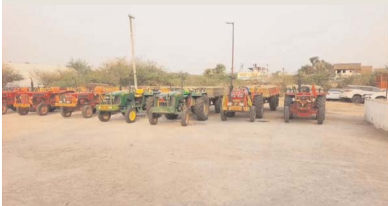
మిర్యాలగూడ, మే 21, ( ప్రజాజ్యోతి ):

ప్రభుత్వ నిబంధనలకు విరుద్ధంగా అక్రమ ఇసుక రవాణాకు పాల్పడితే కఠిన చర్యలు తప్పవని జిల్లా ఎస్పీ శరత్ చంద్ర పవార్ హెచ్చరించారు. మిర్యాలగూడ రూరల్ పోలీస్ స్టేషన్ పరిధిలో గురువారం ఇసుక రవాణా ట్రాక్టర్ డ్రైవర్లు, యజమానులు, అక్రమ రవాణాకు పాల్పడుతున్న వారి కి ప్రత్యేక కౌన్సెలింగ్ నిర్వహించి, అవగాహన కల్పించారు. ఈసందర్భంగా ఎస్పీ మాట్లాడుతూ జిల్లాలో అక్రమ ఇసుక రవాణాపై పోలీసులు, కట్టుదిట్టమైన చర్యలు చేపట్టడంతో ప్రభుత్వ ఆదాయం గణనీయంగా పెరిగిందన్నారు. 2024 సంవత్సరంలో ఇసుక ద్వారా ప్రభుత్వానికి రూ.35 కోట్ల ఆదాయం వచ్చిందని, 2025 సంవత్సరంలో అది రూ.43 కోట్లకు పెరిగిందన్నారు. ప్రస్తుతం 2026 సంవత్సరంలో ఇప్పటివరకు ఇసుక