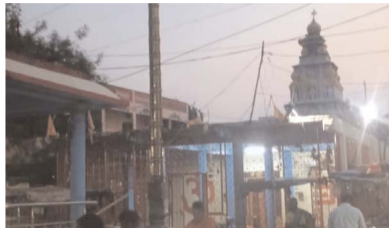
వేలం పాటకు హాజరు కాకపోవడం వల్ల తాత్కాలికంగా వాయిదా పడడం జరిగింది. వచ్చేవారం తప్పనిసరిగా బహిరంగం కౌలు వేలం పాట నిర్వహించడం జరుగుతుందని, రైతులకు కలిగిన ఇబ్బందికి చింతిస్తున్నామని ఆమె చెప్పారు.

:మండల కేంద్ర పట్టణమైన నాంపల్లి అంగడి బజారులోని శ్రీ రాధా రుక్మిణి సమేత వేణుగోపాలస్వామి దేవాలయ భూమి బహిరంగం కౌలు వేలం పాట మే 20న బుధవారం నిర్వహించవలసి ఉండగా, అనివార్య కారణాలవల్ల దేవదాయ శాఖ సిబ్బంది బహిరంగం కౌలు