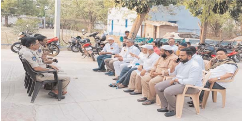
భువనగిరి,మే 21 (ప్రజాజ్యోతి)