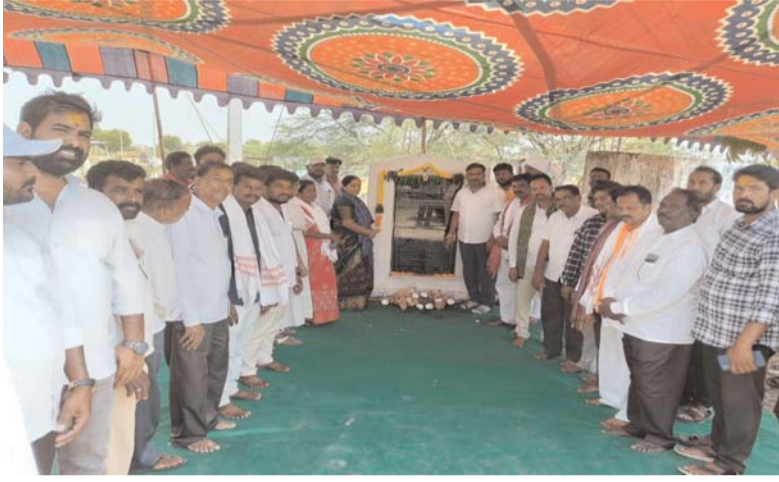
అలేరు మే 21 (ప్రజా జ్యోతి )

అలేరు ఎమ్మెల్యే ప్రభుత్వ విప్ బీర్ల ఐలయ్య