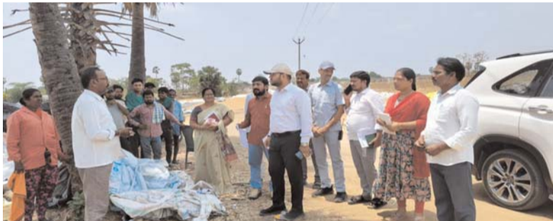
చర్చించి లారీలు తొందరగా దిగుమతి అయ్యే విధంగా చర్యలు తీసుకోవాలని తెలిపారు.. కొనుగోలు కేంద్రాలకు లారీల కొరత, బస్తాల కొరత లేకుండా చూడాల్సిన బాధ్యత నిర్వాహకులదేనని అన్నారు.. వర్ష పరిస్థితులు ఉన్నందున రైతు సోదరులందరూ తమ ధాన్యమును కొనుగోలు అయ్యేంతవరకు తగు జాగ్రత్తలు తీసుకొని, తార్పాలిన్ కవర్లతో కప్పి ఉంచే విధంగా కేంద్ర నిర్వాహకులు చూసుకోవాలని ఆదేశించారు.. ఈ కార్యక్రమంలో తహసీల్దార్ శ్రీనివాసరావు, ఎంపీడీవో సునీత, ఆయా శాఖల అధికారులు, కొనుగోలు కేంద్రం నిర్వాహకులు రైతులు తదితరులు ఉన్నారు..

ధాన్యం కొనుగోలు వేగవంతం చేయాలని సూర్యాపేట జిల్లా కలెక్టర్ తేజస్ నందు లాల్ పవర్ ధాన్యం కొనుగోలు కేంద్రాల నిర్వాహకులకు సూచించారు.. మంగళవారం మండల పరిధిలోని ఎర్రపహాడ్ ధాన్యం కొనుగోలు కేంద్రాన్ని ఆకస్మికంగా తనిఖీ చేశారు కలెక్టర్.. ఐకేపీ సెంటర్ ను పరిశీలించి రైతులతో ముచ్చటించారు.. అనంతరం ఆయన మాట్లాడుతూ.. ఎగుమతి చేసిన మిల్లుల యాజమానులతో అధికారులు