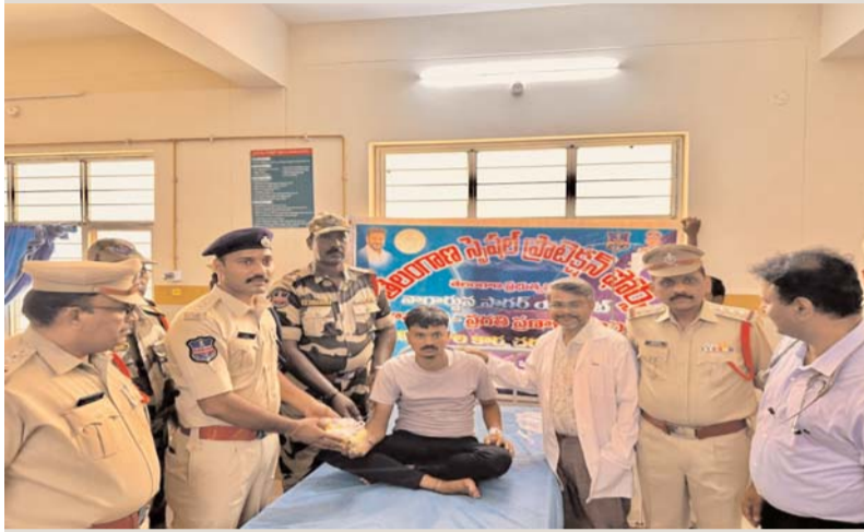
నాగార్జునసాగర్, మే, 19 ప్రజా జ్యోతి