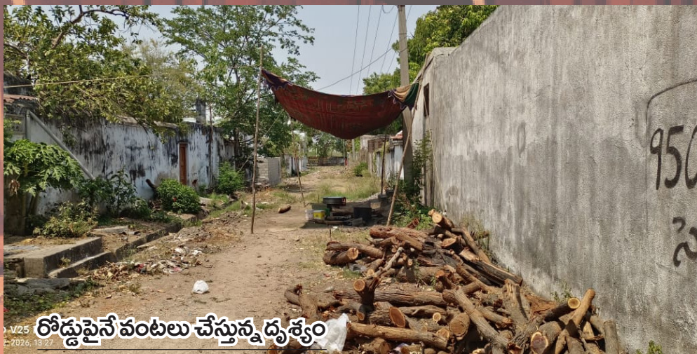
రోడ్డుపైనే వంటలు చేస్తున్న దృశ్యం

నిబంధనలకు నీళ్లు... మామూళ్ల మత్తులో తూగుతున్న అధికారులు ఫిర్యాదు చేసినా పట్టించుకోని అధికారులు బార్ తొలగించాలని కాలనీవాసుల డిమాండ్ రోడ్డుపైనే పార్కింగ్... బహిరంగ మూత్ర విసర్జనతో అవస్థలు ఆ రోడ్డు వెంట నడవాలంటేనే జంకుతున్న మహిళలు