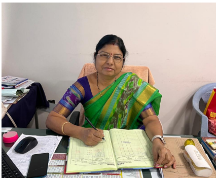
ద్రాలకు చేరుకుని ప్రశాంత వాతావరణంలో పరీక్షలు రాయాలని సూచించారు.

సెకండ్ ఇయర్ కు చెందిన 1,414 మంది విద్యార్థులు పరీక్షలకు హాజరుకానుండగా, మొత్తం 5,078 మంది విద్యార్థులు పరీక్షలు రాయనున్నారు. పరీక్షల నిర్వహణ కోసం ఇద్దరు డీఈసీ సభ్యులు, ఇద్దరు సిట్టింగ్ స్వాగ్డ్ సభ్యులు, ఒక ఫ్లయింగ్ స్వాగ్డ్ బృందం, ఒక కన్వోడియేషన్ నియమించినట్లు అధికారులు తెలిపారు. విద్యార్థులు సకాలంలో పరీక్ష కేంద్రాలకు చేరుకునేలా ప్రత్యేక బస్సు రూట్లను కూడా ఏర్పాటు చేసినట్లు పేర్కొన్నారు. పరీక్ష కేంద్రాలలో విద్యార్థులకు సరిపడా వెలుతురు, తాగునీటి సదుపాయాలు కల్పించినట్లు జిల్లా ఇంటర్మీడియట్ విద్యాధికారి తెలిపారు. విద్యార్థులు సమయానికి పరీక్ష కేంద్రాలకు చేరుకుని ప్రశాంత వాతావరణంలో పరీక్షలు రాయాలని సూచించారు.