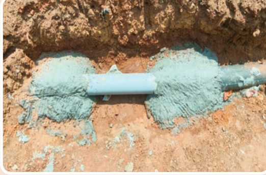
● ఇల్లందు, ప్రజాజ్యోతి

సాధారణంగా మంచినీటి సరఫరా అయ్యే పైప్ లైన్ మరమ్మత్తు పనులను జాగ్రత్తగా పూర్తి చేయాల్సి ఉంటుంది. కానీ ఇల్లందు మున్సిపల్ అధికారులు ప్రజల ప్రాణాలతో చెలగాటం ఆడుతున్నారా అనే ప్రశ్నలు ఉత్పన్నమవుతున్నాయి.