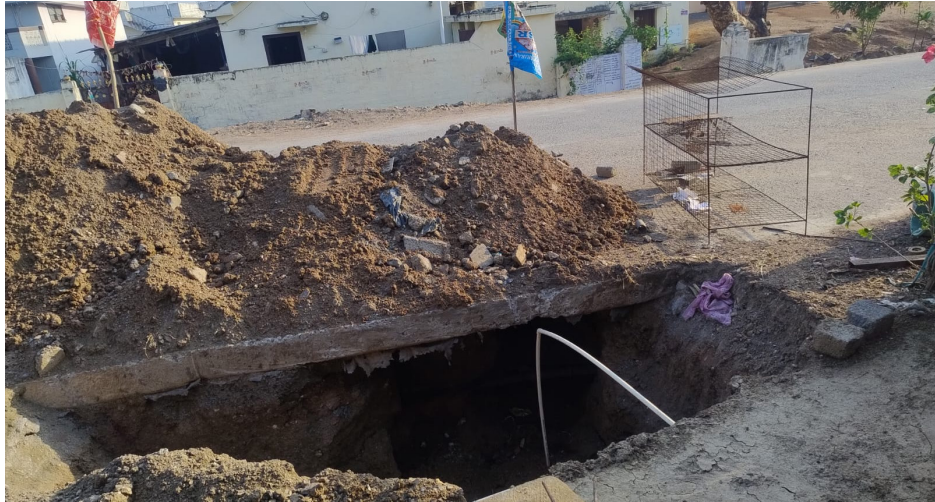
సంబంధిత అధికారులు వెంటనే స్పందించి పైప్ లైన్ మరమ్మతు పనులను పూర్తి చేసి గ్రామానికి త్రాగునీటి సరఫరా పునరుద్ధరించాలని గ్రామ ప్రజలు కోరుతున్నారు.

మండలంలోని బూరుగుపల్లి గ్రామంలో త్రాగునీటి సమస్య తీవ్రంగా మారిందని గ్రామస్తులు అసహనం వ్యక్తం చేస్తున్నారు. గ్రామంలో గుంతతవ్వి 15 రోజులు గడుస్తున్నా పైప్ లైన్ మరమ్మతుల కాలేదని గ్రామస్తు లు తెలిపారు. అధికారులు పనులను ప్రారంభించి, మధ్యలోనే నిలిపివేయడంతో ప్రజలు తీవ్ర ఇబ్బందు లు ఎదుర్కొంటున్నారు. వేసవి తీవ్రత పెరిగిన ఈ సమయంలో త్రాగునీటి సరఫరా నిలిచిపోవడంతో మహిళలు, వృద్ధులు ఇబ్బందులకు గురవుతున్నారు. గ్రామస్తులు గ్రామ సభలో పలుమార్లు సంబంధిత అధికారులకు సమాచారం అందించినప్పటికీ ఇప్పటివరకు నీటి సమస్య పరిష్కరించలేదని, పనులు పూర్తి చేయలేదని ఆవేదన వ్యక్తం చేస్తున్నారు. పాలకుల తీరు పై విమర్శలు చేస్తున్నారు. తవ్వి గుంతలను అలాగే వదిలేయడంతో ప్రమాదాలు జరిగే అవకాశముందని ప్రజలు ఆందోళన చెందుతున్నారు.