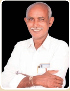
మచ్చలేని నాయకుడు తుమ్మల... నిర్మల పుల్లారావు డిసిసిబి డైరెక్టర్

శాస్త్రీయ దృక్పథంతో ముందుకు సాగుతున్నారన్నారు. ఆయిల్ ఫామ్ సాగును లాభదాయక పంటగా మార్చేందుకు ఆయన తీసుకుంటున్న చర్యలు రైతుల్లో నూతన ఆశలు రేకెత్తిస్తున్నాయన్నారు. రైతులకు అధిక దిగుబడులు వచ్చే విధంగా నాణ్యమైన మొక్కల పంపిణీ, ఆధునిక సాగు పద్ధతులపై అవగాహన కార్యక్రమాలు, నీటి నిర్వహణపై ప్రత్యేక దృష్టి పెట్టడం వంటి అంశాల్లో తుమ్మల చొరవ చూపుతున్నారని చెప్పారు. అలాగే ఆయిల్ ఫామ్ పంటకు మార్కెట్ సౌకర్యాలు కల్పించడం, ప్రాసెసింగ్ యూనిట్ల ఏర్పాటుకు ప్రోత్సాహం ఇవ్వడం ద్వారా రైతుల ఆదాయం పెంచే దిశగా ప్రభుత్వం కృషి చేస్తోందన్నారు. వ్యవసాయ రంగంపై పూర్తి అవగాహనతో శాస్త్రవేత్తలా పనిచేస్తున్న తుమ్మల నాయకత్వంలో ఆయిల్ ఫామ్ సాగు రాష్ట్రంలో మరింత విస్తరించే అవకాశాలు ఉన్నాయన్నారు.