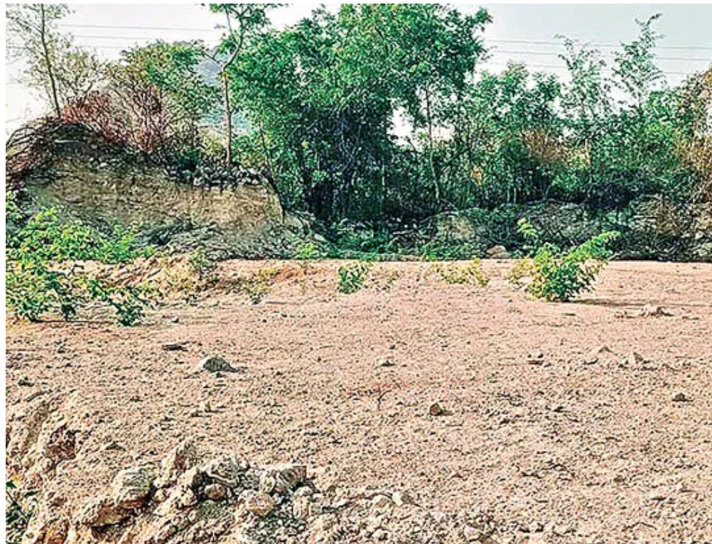
మాత్రమే వెళ్తున్నాయి. అధికారులు కూడా పరిశీలించడం ఇప్పటికైనా అధికారులు సరిహద్దులను ఏర్పాటు చేయిస్తే ప్రకృతి కాదు అతి కష్టం మీద వెళ్లాల్సిన పరిస్థితి నెలకొంది. భుత్వ స్థలాన్ని కాపాడినవారవుతారు.

మట్టి మాయం కావడంతో భూమిని చదును చేసి పంటలు సాగు చేస్తున్నారు. కాలువను ఆనుకొని సాగు చేయడంతో రహదారి ఇరుకుగా మారింది. కేవలం చిన్న వాహనాలు