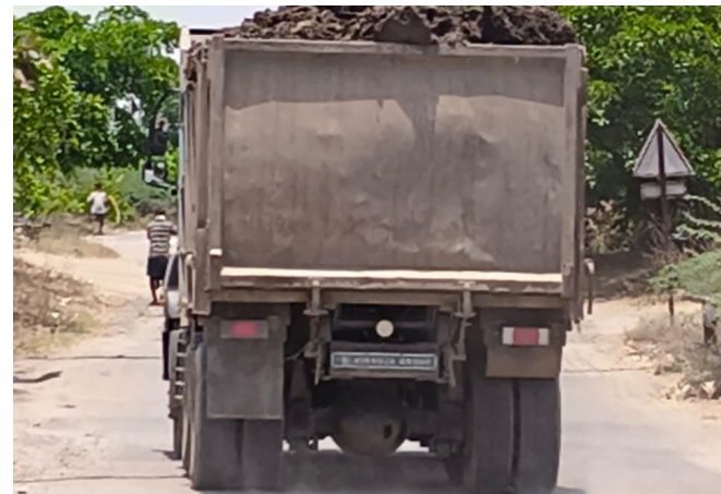
ర్యహించి, ఓవర్లోడ్ టిప్పర్లను వెంటనే నిలిపివేయాలని, గ్రామీణ రహదారులపై ప్రత్యేక పర్యవేక్షణ ఏర్పాటు చేయాలని ప్రజలు డిమాండ్ చేస్తున్నారు.

ణభయంతో ప్రయాణించాల్సిన పరిస్థితి ఏర్పడిందని స్థానికులు ఆవేదన వ్యక్తం చేస్తున్నారు. రాత్రి, పగలు తేడా లేకుండా నిర్లక్ష్యంగా నడుస్తున్న టిప్పర్లను తక్షణమే కట్టడి చేయాలని వారు కోరుతున్నారు. “ప్రమాదం జరిగేలోపు అధికారులు స్పందించి, పరిమితి మించిన వాహనాలపై కఠిన చర్యలు తీసుకోవాలి. ప్రజల ప్రాణాలను రక్షించాలి” అని ప్రజలు విజ్ఞప్తి చేస్తున్నారు. ఇప్పటివరకు అధికారులు స్పందించకపోవడం వల్లే సమస్య మరింత తీవ్రమవుతోందిని వారు ఆరోపిస్తున్నారు. స్థానికులు వాహనాలపై కఠిన తనిఖీలు ని