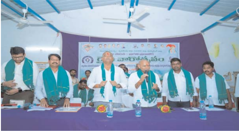
మిర్యాలగూడ, మే 06, ( ప్రజాజ్యోతి ):