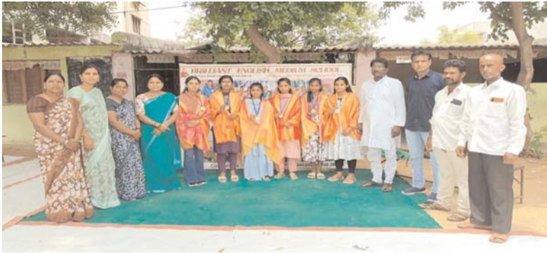
అత్యుత్తమ అథ్లెట్స్ డే