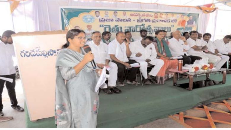
కోదాడ టౌన్, మే 06 (ప్రజా జ్యోతి):