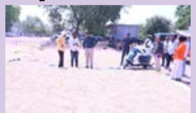
పెద్దపల్లి ప్రతినిధి, మే 05 ప్రజా జ్యోతి:

ధాన్యం లోడింగ్, అన్ లోడింగ్ పనులు వేగవంతంగా నిర్వహించేలా చర్యలు తీసుకోవాలని జిల్లా కలెక్టర్ కోయ శ్రీ హర్ష* తెలిపారు. మంగళవారం *ఎలిగేడు మండలంలోని సర్సూర్ ఐకేపీ, మంథనిలోని గంగపురి ఐకేపీ కొనుగోలు కేంద్రాలను జిల్లా కలెక్టర్ కోయ శ్రీ హర్ష* పరిశీలించారు. 8