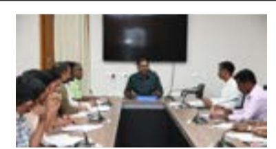
తాగునీటి సమస్య తలెత్తకుండా పటిష్ట చర్యలు తీసుకోవాలి