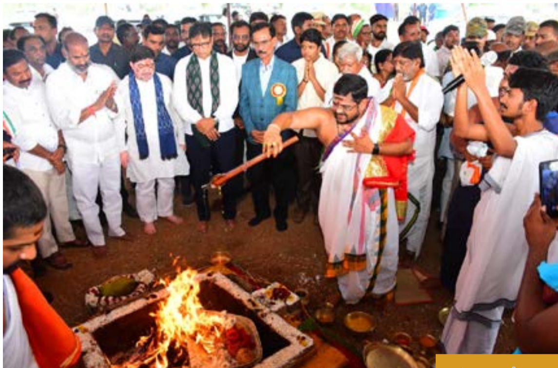
గంభీరావుపేటలో కంప్రెస్డ్ బయో గ్యాస్ ప్లాంట్