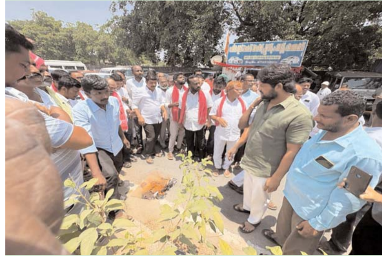
ఆలేరు, మే 5 ప్రజా జ్యోతి