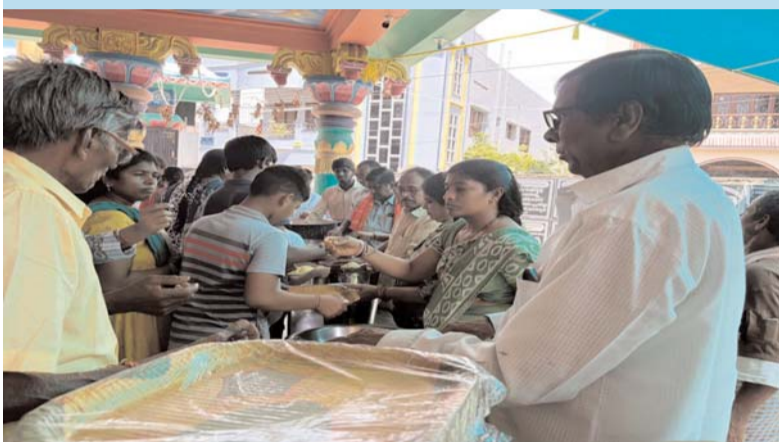
కోదాడ టౌన్, మే 05 ( ప్రజా జ్యోతి):