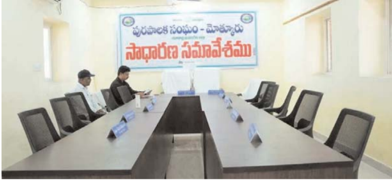
మోతూరు, మే 5 (ప్రజా జ్యోతి):