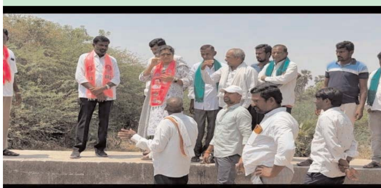
మునుగోడు, మే, 05 (ప్రజా జ్యోతి)